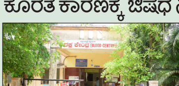
• ಉದಯವಾಹಿನಿ ಚಿತ್ರ

ಇಲ್ಲಿನ ಜಿಲ್ಲಾ ಆಸ್ಪತ್ರೆಯಲ್ಲಿ ಇರುವ ರಕ್ತನಿಧಿ ಕೇಂದ್ರ ಪರವಾನಗಿ ನವೀಕರಣದ ಸಮಸ್ಯೆ ಸಿಲುಕಿದೆ. ಇದರಿಂದ ತನ್ನ ಕಾರ್ಯ ಚಟುವಟಿಕೆಯನ್ನು ಸಂಪೂರ್ಣ ಸ್ಥಗಿತಗೊಳಿಸಿದ್ದು, ರೋಗಿಗಳು ಪರದಾಡುವಂತೆ ಆಗಿದೆ. ಅಗತ್ಯ ಸೌಲಭ್ಯ, ನಿರ್ವಹಣೆ ಕೊರತೆ ಕಾರಣಕ್ಕೆ ಔಷಧ ನಿಯಂತ್ರಣ ಇಲಾಖೆ ಅಧಿಕಾರಿಗಳು ಕೇಂದ್ರದ ಕಾರ್ಯ ಚಟುವಟಿಕೆ ಸ್ಥಗಿತಗೊಳಿಸಲು ಸೂಚಿಸಿದ್ದಾರೆ. ಈ ಕಾರಣಕ್ಕೆ 2 ವಾರಗಳಿಂದ ರಕ್ತ ಸಂಗ್ರಹಣೆ ನಡೆಯುತ್ತಿಲ್ಲ. ಈಗಾಗಲೇ ಸಂಗ್ರಹಿಸಿದ್ದ ರಕ್ತವನ್ನು ಮೇ ಮೊದಲ ವಾರದವರೆಗೂ ವಿತರಿಸಲಾಗಿದೆ. ಇದರಿಂದಾಗಿ ಸರ್ಕಾರಿ ಆಸ್ಪತ್ರೆಯಲ್ಲಿ ರೋಗಿಗಳಿಗೆ ತುರ್ತು ಸಂದರ್ಭದಲ್ಲಿ ರಕ್ತ ದೊರೆಯುತ್ತಿಲ್ಲ. ಜಿಲ್ಲಾ ಆಸ್ಪತ್ರೆಯ ರಕ್ತನಿಧಿ ಕೇಂದ್ರದಲ್ಲಿ 500ರಿಂದ 600 ಯೂನಿಟ್ ರಕ್ತ ಸಂಗ್ರಹ ಸಾಮರ್ಥ್ಯವಿದೆ. ಪ್ರತಿ ತಿಂಗಳು ಅಂದಾಜು 350ರಿಂದ