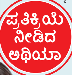
ಪ್ರತಿಕ್ರಿಯೆ ನೀಡಿದ ಅಧಿಯಾ

ಲಹರಿ ಸೂಪರ್ ಜೈಂಟ್ಸ್ ತಂಡದ ಮಾಲಿಕ ಸಂಜೀವ್ ಗೋಯೆಂಕಾ ಈಗ ತಾಂತ್ರಿಕವಾಗಿ ಕೆಎಲ್ ರಾಹುಲ್ ಪಟ್ಟಿ ಅಧಿಯಾ ಶಿಷ್ಟ ಪ್ರಕ್ರಿಯೆಯಲ್ಲಿದ್ದಾರೆ. ಮುಂದಿನ ವರ್ಷ ಕೆಎಲ್ ರಾಹುಲ್ ಅವರು ಬೇರೆ ಟೀಮ್‌ಗೆ ಆಡಲಿದ್ದಾರೆ ಎಂಬ ಊಹಾಪೋಹ ಹರಡಿತು. ಆದರೂ ಈಗ ಪೂರ್ಣ ವಿರಾಮ ಬಿಡುತ್ತೇನೆ ಅಂದೇ ಆಗಿದೆ. ಈ ಬಾರಿಯ ಇಂಡಿಯನ್ ಪ್ರೀಮಿಯರ್ ಲೀಗ್ ರೋಚಕ ಹಂತ ತಲುಪಿದೆ. ಈ ನಡುವೆ ಲಹರಿ ಸೂಪರ್ ಜೈಂಟ್ಸ್ ತಂಡದ ಕ್ಯಾಪ್ಟನ್ ಕೆಎಲ್ ರಾಹುಲ್ ಅಭಿಮಾನಿಗಳು ತೀವ್ರ ಬೇಸರ ಮಾಡಿಕೊಂಡಿದ್ದಾರೆ. ತಂದೆ ಮಾಲಿಕ ಸಂಜೀವ್ ಗೋಯೆಂಕಾ ಜೊತೆ ನಡೆದ ಬಿರುಸು ಮಾತುಕಥೆಯು ದೃಶ್ಯ ವೈರಲ್ ಆದ ಬಳಿಕ ಸೋಶಿಯಲ್ ಮೀಡಿಯಾದಲ್ಲಿ ಹತ್ತಾರು ಬಗೆಯ ಚರ್ಚೆ ನಡೆದಿದೆ. ಈ ನಡುವೆ ಕೆಎಲ್ ರಾಹುಲ್ ಅವರ ಪತ್ನಿ, ನಟಿ ಅಧಿಯಾ ಶಿಷ್ಟ ಮಾರ್ಮಿಕವಾಗಿ ಪ್ರತಿಕ್ರಿಯೆ ನೀಡಿದ್ದಾರೆ. ಇನ್‌ಸ್ಟಾಗ್ರಾಮ್ ಸ್ಟೋರಿಯಲ್ಲಿ ಅವರು ಒಂದು ಸಾಲನ್ನು ಹಂಚಿಕೊಂಡಿದ್ದಾರೆ.