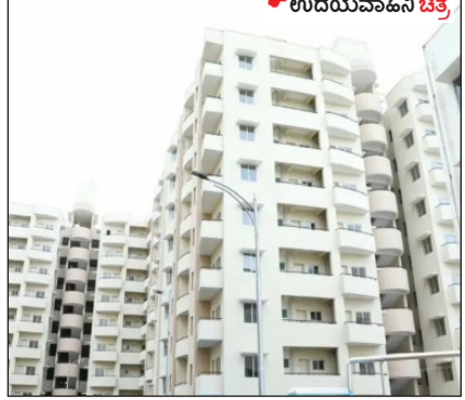
• ಉದಯವಾಹಿನಿ ಚಿತ್ರ

ಇವುಗಳ ದರಗಳಿಗೆ ಹೋಲಿಸಿದರೆ, ಕೋನದಾಪುರದಲ್ಲಿ ಕಡಿಮೆ ಹೆಚ್ಚಳವಾಗಿದೆ. ಬಿಡಿಎಯು 632 ಫ್ಲಾಟ್‌ಗಳಲ್ಲಿ ಮಾರಾಟದ 300 ಫ್ಲಾಟ್‌ಗಳಿಗೆ 4% ರಷ್ಟು ಸ್ವಲ್ಪ ಹೆಚ್ಚಳಕ್ಕೆ ಪ್ರಸ್ತಾಪಿಸಲಾಗಿದೆ. ಹಂತ I ರಲ್ಲಿ 3 ಬಿಎಚ್‌ಕೆ ರೂ. 65.7 ಲಕ್ಷವಾಗಿದೆ. ಈ ಹಿಂದೆ ಯೋಜಿತ ವೆಚ್ಚ ರೂ. 53 ಲಕ್ಷ