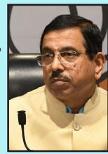
ಪ್ರಹ್ಲಾದ ಜೋಶಿ ಸಚಿವ