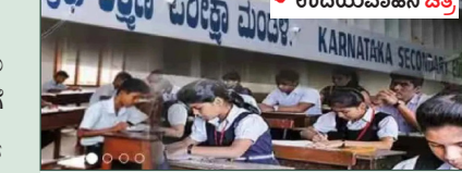
• ಉದಯವಾಹಿನಿ ಚಿತ್ರ

2024ರ ಎಸ್‌ಎಸ್‌ಎಲ್‌ಸಿ ಪರೀಕ್ಷೆ-2ಕ್ಕೆ ಪರೀಕ್ಷಾ ಕೇಂದ್ರಗಳನ್ನು ರಚಿಸಿ ಪ್ರಸ್ತಾವನೆಯನ್ನು ಮಂಡನೆಗೆ ಸಲ್ಲಿಸುವಂತೆ ಕರ್ನಾಟಕ ಶಾಲಾ ಪರೀಕ್ಷೆ ಮತ್ತು ಮೌಲ್ಯ ನಿರ್ಣಯ ಮಂಡಳಿ ಆದೇಶ ಹೊರಡಿಸಿದೆ. 2024ರ ಪರೀಕ್ಷೆ-2ಕ್ಕೆ ಪರೀಕ್ಷಾ ಕೇಂದ್ರಗಳನ್ನು ರಚಿಸುವುದು ಅತ್ಯಂತ ಪ್ರಾಮುಖ್ಯ ಕಾರ್ಯವಾಗಿದೆ. ಪರೀಕ್ಷಾ ಕೇಂದ್ರ ರಚನೆಯ ನಂತರವೇ ಪ್ರವೇಶಪತ್ರ, ಕೇಂದ್ರ ನಾಮಯಾಡಿ, ಶಾಲಾವಾರು ನಾಮಯಾಡಿ, ಹಾಜರಾತಿ ಸಹಿತ ಅಂಕಪಟ್ಟಿ (ಎ.ಎಂ.ಎಲ್), ಪ್ರಶ್ನೆಪತ್ರಿಕೆ ಬೇಡಿಕೆ, ಪರೀಕ್ಷಾ ಕೇಂದ್ರದ ಸಾಬೀಲಾರ್ಥ ಹಂಚಿಕೆಯ ಪ್ರಕ್ರಿಯೆ ಕೈ ಗೊಳ್ಳಬೇಕಾಗಿದೆ.