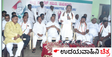
ಉದಯವಾಹಿನಿ ಚಾನೆಲಿನಲ್ಲಿ ಹೇಮಾವತಿ ಲಿಂಕ್ ಕೆನಾಲ್ ನಿಲ್ಲಿಸುವ ಪ್ರಯತ್ನ ಮಾಡಲಾಗಿದೆ

ಉದಯವಾಹಿನಿ ಚಾನೆಲಿನಲ್ಲಿ ಹೇಮಾವತಿ ಲಿಂಕ್ ಕೆನಾಲ್ ನಿಲ್ಲಿಸುವ ಪ್ರಯತ್ನ ಮಾಡಲಾಗಿದೆ.