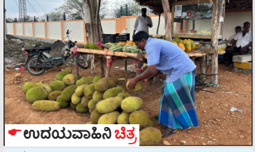
ಉದಯವಾಹಿನಿ ಚಾನೆಲಿನಲ್ಲಿ ಹಲಸಿನ ಸೀಸನ್ ಆರಂಭವಾಗಿದೆ.

ಹಲಸಿನ ಸೀಸನ್ ಆರಂಭವಾಗಿದೆ. ಹಲಸಿನ ಸೀಸನ್ ಆರಂಭವಾಗಿದೆ. ಹಲಸಿನ ಸೀಸನ್ ಆರಂಭವಾಗಿದೆ. ಹಲಸಿನ ಸೀಸನ್ ಆರಂಭವಾಗಿದೆ.