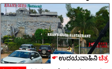
ಉದಯವಾಹಿನಿ ಚಾನೆಲಿನಲ್ಲಿ ನಾಮಫಲಕಗಳಲ್ಲಿ ಕಾನೆಯಾದ 'ಕನ್ನಡ'

ಉದಯವಾಹಿನಿ, ಗುಂಡ್ಲುಪೇಟೆ ನಾಮಫಲಕಗಳಲ್ಲಿ ಕಾನೆಯಾದ 'ಕನ್ನಡ' ಲೇಖನಿಯನ್ನು ಸರ್ಕಾರದ ಅಭಿವೃದ್ಧಿ ಸಾಧನೆಗಾಗಿ ಗುರುತಿಸಿದೆ.