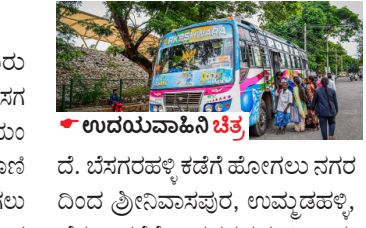
ಉದಯವಾಹಿನಿ ಚಾನೆಲಿನಲ್ಲಿ ಸ್ವೇಡಿಯಂ ಬಸ್‌ಸ್ಟಾಂಡ್, ತಂಗುದಾಣ ನಿರ್ಮಿಸಿ

ಚಮಂಡ್, ಖಾಸಗಿ ಬಸ್‌ಗಳಲ್ಲಿ ನಿತ್ಯ ನೂರಾರು ಪ್ರಯಾಣಿಕರು ಹಲವು ವರ್ಷಗಳಿಂದ ಬೆಸಗ ರಹಸ್ಯ ನಾಗಮಂಗಲಕ್ಕೆ ನಗರದ ಸ್ವೇಡಿಯಂ ಬಸ್‌ಸ್ಟಾಂಡ್ ನಿರ್ಮಿಸುವುದಕ್ಕೆ ಸರ್ಕಾರದ ಅಭಿವೃದ್ಧಿ ಸಾಧನೆಗಾಗಿ ಗುರುತಿಸಿದೆ.