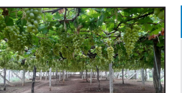
ಉದಯವಾಹಿನಿ ಚಾನೆಲಿನಲ್ಲಿ ದ್ರಾಕ್ಷಿ ಬೆಲೆ ಕುಸಿತ

ಉದಯವಾಹಿನಿ, ಚಿಕ್ಕಬಳ್ಳಾಪುರ ದ್ರಾಕ್ಷಿ ಬೆಲೆ ಕುಸಿತ. ಚಿಕ್ಕಬಳ್ಳಾಪುರ ಮತ್ತು ಶಿವಮೊಗ್ಗ ತಾಲ್ಲೂಕಿನ ಬೆಳೆಗಾರರು ಕಂಗಾಲಾಗಿದ್ದಾರೆ.