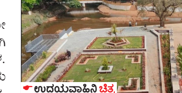
ಉದಯವಾಹಿನಿ ಚಾನೆಲಿನಲ್ಲಿ ಕಂಗೊಳಿಸುತ್ತಿದೆ 3 ನದಿಗಳ ತ್ರಿವೇಣಿ ಸಂಗಮ

ಉದಯವಾಹಿನಿ, ಸಾವೇರಿಕಟ್ಟೆ ಮಡಿಕೇರಿಯಿಂದ ಪಶ್ಚಿಮಕ್ಕೆ 40 ಕಿ.ಮೀ ದೂರದಲ್ಲಿರುವ ಭಾಗಮಂಡಲ ಕೊಡಗಿನ ಪ್ರಮುಖ ಪ್ರದೇಶವಾದ ಭಾಗಮಂಡಲ ಕೊಡಗಿನ ಸಂಗಮ ಸ್ಥಳವನ್ನು ಸರ್ಕಾರದ ಅಭಿವೃದ್ಧಿ ಸಾಧನೆಗಾಗಿ ಗುರುತಿಸಿದೆ.