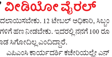
ಉದಯವಾಹಿನಿ ಚಾನೆಲಿನಲ್ಲಿ ಮಳೆಗೆ ನೋಂದಣಿ '12 ಟೀಬಲ್' ಲಂಚ ಕೊಡ್ಡೇಕು ಎಂಪಿಎಂಸಿ ಕಾರ್ಯದರ್ಶಿ' ವೀಡಿಯೋ ವೈರಲ್

ಎಂಪಿಎಂಸಿ ಕೋಲಾರ ಮಳೆಗೆ ನೋಂದಣಿ '12 ಟೀಬಲ್' ಲಂಚ ಕೊಡ್ಡೇಕು ಎಂಪಿಎಂಸಿ ಕಾರ್ಯದರ್ಶಿ ವೀಡಿಯೋ ವೈರಲ್. 12 ಟೀಬಲ್ ಅಧಿಕಾರಿ, ಸಿಬ್ಬಂದಿಗಳಿಗೆ ಹಣ ನೀಡಬೇಕು. ಇದರಲ್ಲಿ ನನಗೆ 100 ರೂ ಕೊಡ ಸಿಗೋದಿಲ್ಲ ಎಂದು ದಿವ್ಯಾ ಎಂಪಿಎಂಸಿ ಕಾರ್ಯದರ್ಶಿ ಕಚೇರಿಯಲ್ಲಿ ಎನ್.ಎಸ್.ಎಸ್. ವೈರಲ್ ಆಗಿದೆ.