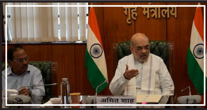
ಭಯೋತ್ಪಾದನೆ ನಿರ್ಮೂಲನೆಗೆ ಯೋಜನೆ