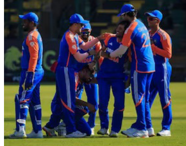
ಪ್ರಸ್ತುತ ಜಂಬಾಬ್ವೆ ಪ್ರವಾಸದಲ್ಲಿರುವ ಟೀಂ ಇಂಡಿಯಾ 5 ಪಂದ್ಯಗಳ ಖಿ20 ಸರಣಿಯಲ್ಲಿ ನಿರತನಾಗಿದೆ.

ಹೈದರಾಬಾದ್ ನಡೆದ ಭಾರತ ಮತ್ತು ಜಂಬಾಬ್ವೆ ನಡುವಿನ ಕೊನೆಯ 5ನೇ ಖಿ20 ನಲ್ಲಿ ಟೀಮ್ ಇಂಡಿಯಾ ಭರ್ಜರಿ ಜಯ ಗಳಿಸಿದೆ.