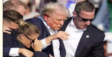
ತಂಕಿತ ಶೂಟರ್ ಹತ್ಯೆ ಟ್ರಂಪ್ ಕೊಲೆ ಪ್ರಯತ್ನದಲ್ಲಿ ಸಭೆಯಲ್ಲಿ ಭಾಗವಹಿಸಿದ ರಿಪಬ್ಲಿಕನ್ ಪಕ್ಷದ ಬೆಂಬಲಿಗರೊಬ್ಬರು ಹತ್ಯೆಯಾಗಿದ್ದಾರೆ.

ನಮ್ಮ ದೇಶದಲ್ಲಿ ತಾವಿಲ್ಲ ಎಂಬ ಸೆನೇಟ್ ಬಹುಮತದ ನಾಯಕ ಚಕ್ರಾಂತಿ ನಡೆದಿದ್ದಾರೆ. ಇದು ಪ್ರತಿಯೊಬ್ಬ ಸ್ವಾತಂತ್ರ್ಯ ಪ್ರೇಮಿ ಅಮೆರಿಕನ್ನರಿಗೂ ಅಪಾಕಾರಿ ಘಟನೆಯಾಗಿದೆ. ಅಧ್ಯಕ್ಷೀಯ ಅಭ್ಯರ್ಥಿಗಳ ಮೇಲಿನ ಹಿಂಸಾಚಾರವನ್ನು ನಡೆಸಲು ಬಿಡಬಾರದು. ನಾವು ಡೋನಾಲ್ಡ್ ಟ್ರಂಪ್, ಅವರ ಇಡೀ ಕುಟುಂಬದ ಕ್ಷೇಮಕ್ಕಾಗಿ ಪ್ರಾರ್ಥನೆ ಸಲ್ಲಿಸುತ್ತಿದ್ದೇವೆ ಎಂದು ಅಧ್ಯಕ್ಷೀಯ ಚುನಾವಣಾ ರಿಪಬ್ಲಿಕನ್ ಪಕ್ಷದ ಮಾಜಿ ಅಧ್ಯರ್ಥಿ ನಿಕ್ ಹ್ಯಾರಿ ತಿಳಿಸಿದ್ದಾರೆ.