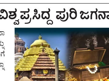
ರತ್ನ ಭಂಡಾರ ತೆರೆದಂತೆ ಕಾಣಿಸಿದ ಭಂಡಾರ

ಸೂಚನೆ ಮೇರೆಗೆ ಸಾಂಪ್ರದಾಯಿಕ ಉಡುಪುಗಳನ್ನು ಧರಿಸಿ, ಮೊದಲು ದೇವಾಲಯದ ಒಳಗೆ ಲೋಕಾರ್ಪಣೆ ನಡೆಸಿದ ರತ್ನ ಭಂಡಾರ ತೆರೆವುಗೊಳಿಸಿತು. ದೇವಸ್ಥಾನದ ಒಳಗೆ ಹಾವುಗಳು ಇರುವ ಬಗ್ಗೆ ಶಂಕೆ ಇದ್ದ ಕಾರಣ ಹಾವು ಒಡಿಯುವವರನ್ನು ಭಂಡಾರಕ್ಕೆ ಕರೆದೊಯ್ಯಲಾಗಿತ್ತು. ದೇವಸ್ಥಾನದಲ್ಲಿನ ನಿಧಿಯನ್ನು ನಾಗಪಕ್ಷಿಗಳ ಕಾಯುತ್ಪನ್ನ ಭಂಡಾರವನ್ನು ತೆರೆವುಗೊಳಿಸಿತ್ತು. ಸಮಿತಿ