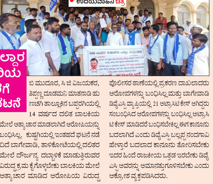
ಉದಯವಾಹಿನಿ ಚಿತ್ರ ಬಿ.ಮುದ್ದೇಬಿಹಾಳ, ಸಿ.ಜಿ.ವಿಜಯಪುರ, ತಿಪ್ಪಣ್ಣ ದೂಡಮನಿ ಮಾತನಾಡಿ ಹುಣಿಸೆ ತಾಲ್ಲೂಕಿನ ಬಸ್ಸುಗಳಲ್ಲಿ 14 ವರ್ಷದ ದಲಿತ ಬಾಲಕಿಯ ಪೊಲೀಸ್ ಅಧಿಕಾರಿಗಳ ಮೇಲೆ ಕ್ರಮ ಕೈಗೊಳ್ಳಲು ಸೇರಿದಂತೆ ಹತ್ತು ಬೇಡಿಕೆಗಳ ಮನವಿ ಪತ್ರವನ್ನು ದಿನ ಬಾಗೇವಾಡಿ, ತಾಳಿಕೋಟಿಯಲ್ಲಿ ದಲಿತರ ಕಚೇರಿಯ ಮೂಲಕ ಸಲ್ಲಿಸಿದರು.

ಉದಯವಾಹಿನಿ, ಮುದ್ದೇಬಿಹಾಳ ವಿಜಯಪುರ ಜಿಲ್ಲೆಯಲ್ಲಿ ದಲಿತರ ಮೇಲೆ ನಿರಂತರ ದೌರ್ಜನ್ಯ ದಬ್ಬಾಳಿಕೆ ಜಾರಿ ನಡೆದ ನಡುವೆ ಸಂಭಂದಿಸಿದ ಪೊಲೀಸ್ ಇಲಾಖೆ ಸೂಕ್ತ ಕ್ರಮ ಕೈಗೊಂಡು ದಲಿತರ ಮೇಲೆ ದೌರ್ಜನ್ಯ ಮಾಡುವ ಅಧಿಕಾರಿಗಳನ್ನು ಅಮಾನತ್ತುಗೊಳಿಸಬೇಕೆಂದು ಮಂಗಳವಾರ ಮುದ್ದೇಬಿಹಾಳ ತಾಲ್ಲೂಕಿನ ವಿವಿಧ ದಲಿತರ ಸಂಘಟನೆಗಳ ಒಕ್ಕೂಟದಿಂದ ಬೃಹತ್ ಪ್ರತಿಭಟನೆಯನ್ನು ಹಮ್ಮಿಕೊಳ್ಳಲಾಗುತ್ತದೆ.