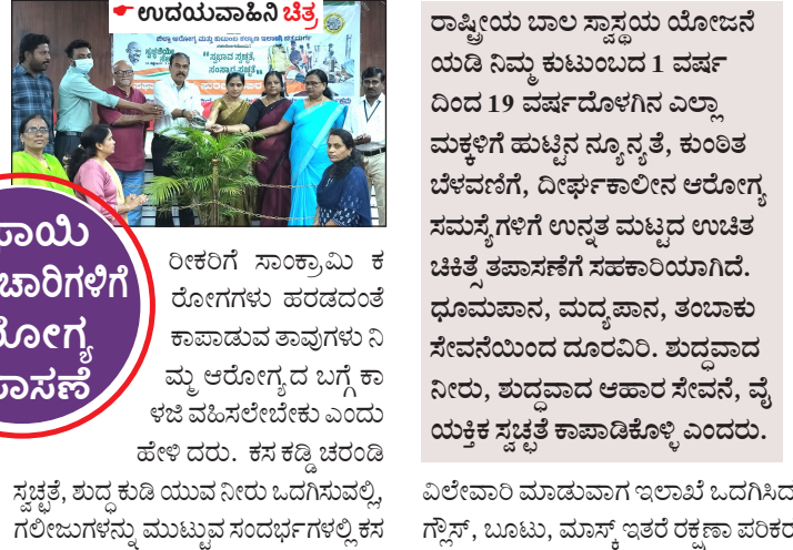
ಉದಯವಾಹಿನಿ ಚಿತ್ರ ರಾಷ್ಟ್ರೀಯ ಬಾಲ ಸ್ವಾಸ್ಥ್ಯ ಯೋಜನೆ ಯಡಿ ನಿಮ್ಮ ಕುಟುಂಬದ 1 ವರ್ಷದಿಂದ 19 ವರ್ಷದವರೆಗಿನ ಎಲ್ಲಾ ಮಕ್ಕಳಿಗೆ ಹುಟ್ಟಿನ ನ್ಯೂನತೆ, ಕುಂಠಿತ ಬೆಳವಣಿಗೆ, ದೀರ್ಘಕಾಲೀನ ಆರೋಗ್ಯ ಸಮಸ್ಯೆಗಳಿಗೆ ಉನ್ನತ ಮಟ್ಟದ ಉಚಿತ ಚಿಕಿತ್ಸೆ ತಜ್ಞಾಜಿಗಳ ಸಹಕಾರವಾಗಿದೆ. ಧೂಮಪಾನ, ಮದ್ಯಪಾನ, ತಂಬಾಕು ಸೇವನೆಯಿಂದ ದೂರವಿರಿ. ಶುದ್ಧವಾದ ನೀರು, ಶುದ್ಧವಾದ ಆಹಾರ ಸೇವನೆ, ವೈಯಕ್ತಿಕ ಸ್ವಚ್ಛತೆ ಕಾಪಾಡಿಕೊಳ್ಳಿ ಎಂದರು.