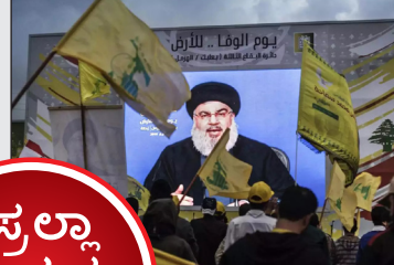
ರಕ್ಷಣಾ ಪಡೆ (ಇಡಿಎಫ್) ತನ್ನ ಹೆಚ್ಚು ಲಾಭ ಮುಖ್ಯಸ್ಥ ಹಸನ್ ನಸ್ಸಲ್ನಾ ದಾಳಿ ಬೆನ್ನಲ್ಲೇ ಇಸ್ರೇಲ್ ನಿಂದ ಪ್ರತೀಕಾರದ ದಾಳಿ: ಉತ್ತರ ಇಸ್ರೇಲ್ ಮೇಲೆ ರಾಕೆಟ್ ಉಡಾರಿಸಿದ್ದು ಹೆಚ್ಚು ಲಾಭ ಇದರ ಹೊಣೆಯನ್ನೂ ಹೊತ್ತುಕೊಂಡಿತ್ತು. ಇಸ್ರೇಲ್ ನ 'ಅನಾಹಿತ್' ಆಕ್ರಮಣದ ವಿರುದ್ಧ ಲೆಬನಾನ್ ರಕ್ಷಣೆಗಾಗಿ ಈ ದಾಳಿ ನಡೆಸಿದ್ದೇವೆ ಎಂದು ಹೆಚ್ಚು ಲಾಭ ಹೇಳಿಕೊಂಡಿತ್ತು. ಇದಾದ ಕೆಲವೇ ಗಂಟೆಗಳಲ್ಲಿ ಇಸ್ರೇಲ್ ಭೀಕರ ಪ್ರತೀಕಾರದ ದಾಳಿಯನ್ನು ಆರಂಭಿಸಿತ್ತು.

ಲೆಬನಾನ್ ಮೇಲೆ ಮುಗಿಬಿಟ್ಟಿತ್ತು ಇಸ್ರೇಲ್ ಹಸನ್ ನಸ್ಸಲ್ನಾ ಗುರಿಯಾಗಿ ಪೂರ್ವ ಹಾಗೂ ದಕ್ಷಿಣ ಲೆಬನಾನ್ ಹಲವು ಭಾಗಗಳ ಮೇಲೆ ಇಸ್ರೇಲ್ ಸೇನೆ ಮುಗಿಬಿಟ್ಟಿತ್ತು. ಹೆಚ್ಚು ಲಾಭ ಉಗ್ರರು ಉತ್ತರ ಇಸ್ರೇಲ್ ಮೇಲೆ ರಾಕೆಟ್ ದಾಳಿ ಆರಂಭಿಸಿದ ಬಳಿಕ ಪ್ರತೀಕಾರದ ಕೈ ಇಸ್ರೇಲ್ ಸರಣಿ ದಾಳಿಗಳನ್ನು ಆರಂಭಿಸಿತ್ತು. ತನ್ನ ಸಶಸ್ತ್ರಧಾರಿಗಳು, ಬೆಂಬಲಿಗರ ಮುಂದೆಯೂ ಈತ ಮುಕ್ತವಾಗಿ ಕಾಣಿಸಿಕೊಳ್ಳುತ್ತಿರಲಿಲ್ಲ. ಸಾರ್ವಜನಿಕವಾಗಿಯೂ ಕಾಣಿಸಿಕೊಂಡಿದ್ದೇ ಇಲ್ಲ. ಹೆಚ್ಚು ಲಾಭ ವಿಡಿಯೋಗಳ ಮೂಲವೇ ಜನರಿಗೆ ದರನ ನೀಡುತ್ತಿದ್ದ. ಲೈವ್‌ನಲ್ಲಷ್ಟೇ ಕಾಣಿಸಿಕೊಳ್ಳುತ್ತಿದ್ದ. ಈತ ಆರಂಭಿಸಿತ್ತು. ತನ್ನ ಸಶಸ್ತ್ರಧಾರಿಗಳು, ಬೆಂಬಲಿಗರ ಮುಂದೆಯೂ ಈತ ಮುಕ್ತವಾಗಿ ಕಾಣಿಸಿಕೊಳ್ಳುತ್ತಿರಲಿಲ್ಲ. ಸಾರ್ವಜನಿಕವಾಗಿಯೂ ಕಾಣಿಸಿಕೊಂಡಿದ್ದೇ ಇಲ್ಲ. ಹೆಚ್ಚು ಲಾಭ ವಿಡಿಯೋಗಳ ಮೂಲವೇ ಜನರಿಗೆ ದರನ ನೀಡುತ್ತಿದ್ದ. ಲೈವ್‌ನಲ್ಲಷ್ಟೇ ಕಾಣಿಸಿಕೊಳ್ಳುತ್ತಿದ್ದ. ಈತ ಆರಂಭಿಸಿತ್ತು.