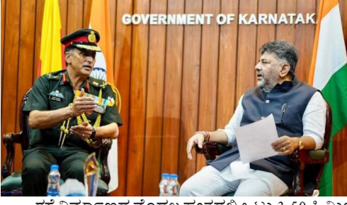
ರಸ್ತೆ ನಿರ್ಮಾಣದ ಮೊದಲ ಹಂತದಲ್ಲಿ ಒಟ್ಟು 3.50 ಕಿ.ಮೀ ಕಾಮಗಾರಿಗಾಗಿ 35 ಕೋಟಿ ರೂಪಾಯಿ ವೆಚ್ಚದ ಟೆಂಡರ್ ಅನ್ನು ಕರೆದಿರಲಾಗಿದೆ. ಟ್ರಿನಿಟಿ ಸರ್ಕಲ್, ಈಜಿಪ್ಟು ರಸ್ತೆ ನಿರ್ಮಾಣಕ್ಕೆ ಇನ್ನು 10.77 ಎಕರೆ ಜಾಗ ರಕ್ಷಣಾ ಇಲಾಖೆ ನೀಡಬೇಕಿದೆ. ಇದು ಕೈಗೊಂಡಿದ್ದು ಐಟಿ ಹೆಚ್ ತೆರಳುವವರಿಗೆ ಸಂಚಾರ ದಟ್ಟಣೆ ಸಮಸ್ಯೆ ನಿವಾರಣೆಯಾಗಲಿದೆ ಎಂದು.

• ಉದಯವಾಹಿನಿ, ಬೆಂಗಳೂರು ರಸ್ತೆ ನಿರ್ಮಾಣಕ್ಕಾಗಿ ಬರೋಬ್ಬರಿ 22 ಎಕರೆ ಜಾಗವನ್ನು ಬಿಬಿಎಂಪಿ ದಿಟ್ಟಿಕ್ಕೋಡಲು ರಕ್ಷಣಾ ಇಲಾಖೆ ತೀರ್ಮಾನಿಸಿದೆ ಎಂದು ಡಿಪಿಎಂ ಡಿ.ಕೆ.ಶಿವಕುಮಾರ್ ಅವರು ತಿಳಿಸಿದರು. ಬೆಂಗಳೂರಿನ ಎಎಸ್ ಸಿ ಸೆಂಟರ್ ಮತ್ತು ಕಾಲೇಜಿನ ಕಮಾಂಡಿಂಗ್ ಲೆಫ್ಟಿನೆಂಟ್ ಜನರಲ್ ಬಸಂತ್ ಕುಮಾರ್ ರೆವ್ಜ್ ಲ್ಲ ಅವರೊಂದಿಗೆ ಇಂದು ಡಿಪಿಎಂ ವಿಧಾನಸೌಧದಲ್ಲಿ ಸಮಾಲೋಚನೆ ನಡೆಸಿದರು. ಬಳಿಕ ಮಾತನಾಡಿದ ಅವರು, ಲೋಕಾರ್ ಅಗರನಿಂದ ಸರ್ಜಾ ಪುರವರೆಗೆ ರಸ್ತೆ ಅಗಲೀಕರಣಕ್ಕಾಗಿ 12.34 ಎಕರೆ ಜಮೀನನ್ನು ರಕ್ಷಣಾ ಇಲಾಖೆ ಬಿಬಿಎಂಪಿಗೆ ನೀಡಿದೆ. ಇನ್ನು 10.77 ಎಕರೆ ನೀಡಲು ತಾತ್ಕಿಕ ಒಪ್ಪಿಗೆ ನೀಡಿದೆ ಎಂದರು. ಎಂಪಿ ರಸ್ತೆಯಿಂದ ಬೆಳ್ಳಂದೂರು ಭಾಗಕ್ಕೆ ತೆರಳಲು ಸುಮಾರು 1 ಗಂಟೆ ಸಮಯ ಬೇಕಾಗಿತ್ತು. ಈ ರಸ್ತೆ ನಿರ್ಮಾಣದ ನಂತರ 5-8 ನಿಮಿಷಗಳ ಅಂತರದಲ್ಲಿ ಕ್ರಮಸಹಜವಾಗಿ ಎಂದು ವಿವರಿಸಿದರು.