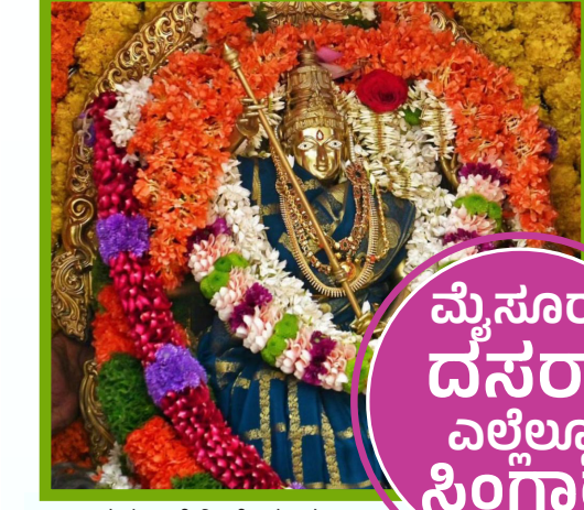
• ಉದಯವಾಹಿನಿ, ಮೈಸೂರು