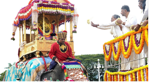
• ಬನ್ನಿಮರಕ್ಕೆ ಪೂಜೆ ಸಲ್ಲಿಸಿದ ರಾಜವಂಶಸ್ಥ ಯದುವೀರ್ • ಲಕ್ಷಾಂತರ ಜನ,ಕಳಿಗಟ್ಟಿದ ಮೈಸೂರು ದಸರಾ • ವಿಶ್ವವಿಖ್ಯಾತ ಜಂಬೂ ಸವಾರಿಗೆ ಚಾಲನೆ; ಸಿಂಹ, ಡಿಸಿಂಹ ಭಾಗಿ • ಬಣ್ಣ ಬಣ್ಣದ ಚಿತ್ತಾರಗಳಿಂದ ಕಂಗೊಳಿಸುತ್ತಿದೆ ಗಜ ಪಡೆ..!