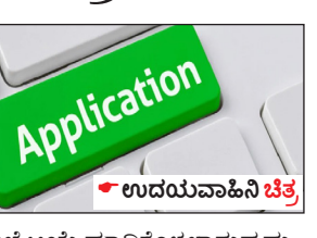
ಉದಯವಾಹಿನಿ ಚಿತ್ರ ಉದಯವಾಹಿನಿ ಚಿತ್ರ

ಉದಯವಾಹಿನಿ,ಬೆಂಗಳೂರು ವಾರ್ತಾ ಮತ್ತು ಸಾರ್ವಜನಿಕ ಸಂಪರ್ಕ ಇಲಾಖೆಯು 2024-25ನೇ ಸಾಲಿಗೆ ಪರಿ ಶಿಷ್ಟ ಜಾತಿ ಪರಿಶಿಷ್ಟ ಪಂಗಡಗಳಿಗೆ ಸೇರಿದ ಪತ್ರಿಕೋದ್ಯಮ ಪದವೀಧರರು ವೃತ್ತಿಯಲ್ಲಿ ತೊಡಗಿಕೊಳ್ಳಲು ಪ್ರೋತ್ಸಾಹಿಸುವ ನಿಟ್ಟಿನಲ್ಲಿ 12 ತಿಂಗಳ ಅಪ್ರೆಂಟಿಸ್ ತರಬೇತಿಯನ್ನು ಹಮ್ಮಿಕೊಂಡಿದ್ದು ಅರ್ಜಿ ಪತ್ರಿಕೋದ್ಯಮ ಪದವೀಧರರಿಂದ ಅರ್ಜಿಗಳನ್ನು ಆಹ್ವಾನಿಸುತ್ತಿದೆ.