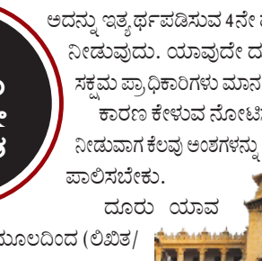
ಉತ್ತರ ನೀಡಲು ಎರಡನೇ ಅವಕಾಶ ಉತ್ತರ ನೀಡಲು ಎರಡನೇ ಅವಕಾಶ

ಉತ್ತರ ನೀಡಲು ಎರಡನೇ ಅವಕಾಶ ಕರ್ನಾಟಕದ ಸರ್ಕಾರಿ ನೌಕರರ ವಿರುದ್ಧ ಸಾರ್ವಜನಿಕರಿಂದ ಹಾಗೂ ಜನಪ್ರತಿನಿಧಿಗಳಿಂದ ಸಲ್ಲಿಕೆಯಾಗುವ ದೂರುಗಳನ್ನು ಇತ್ತೀಚೆಗೆ ಸರ್ಕಾರಿ ಕಾಲಮಿತಿ ನಿಗದಿಗೊಳಿಸಲಾಗಿದೆ.