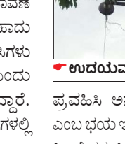
• ಉದಯವಾಹಿನಿ ಚಿತ್ರ

• ಉದಯವಾಹಿನಿ, ಪಾವಗಡ ತಾಲ್ಲೂಕಿನ ಅರಸೀಕೆರೆ ಅಂಚೆಠಾಣೆ ಬಡಾವಣೆ ಮನೆಗಳ ಮೇಲೆ 11 ಕಿ.ವಿ.ವಿದ್ಯುತ್ ತಂತಿ ಹಾದು ಹೋಗಿದೆ. ಇದರಿಂದ ಬಡಾವಣೆ ನಿವಾಸಿಗಳು ಅಂಕದಲ್ಲಿ ಜೀವನ ಸಾಗಿಸಬೇಕೆಂದೆಂದು ಬಡಾವಣೆ ನಿವಾಸಿಗಳು ಆರೋಪಿಸಿದ್ದಾರೆ. ಸರ್ಕಾರ ಮಂಜೂರು ಮಾಡಿರುವ ಮನೆಗಳಲ್ಲಿ ದಶಕಗಳಿಂದ ವಾಸಿಸಲಾಗುತ್ತಿದೆ.