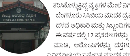
ವಿವಿಧ ರೀತಿಯ ನಿಷೇಧಿತ ವಾದಕ ವಸ್ತುಗಳನ್ನು ವಶಪಡಿಸಿಕೊಂಡು ಸಂಬಂಧಪಟ್ಟ ವ್ಯಕ್ತಿಗಳ ವಿರುದ್ಧ ನಗರದ ವಿವಿಧ ಪೊಲೀಸ್ ಠಾಣೆಗಳಲ್ಲಿ ಪ್ರಕರಣಗಳನ್ನು ದಾಖಲು ಮಾಡಿರುತ್ತಾರೆ ಎಂದಿದೆ.

ಆಫೀಸ್ ಕೇಂದ್ರ ಮೇಲೆ ದಾಳಿ ನಡೆಸಲಾಗಿದ್ದು, ದಾಳಿ ವೇಳೆ ಸ್ಪೋಟಕ ಮಾಹಿತಿ ಬಹಿರಂಗವಾಗಿದೆ. ವಿವಿಧ ದೇಶಗಳಿಂದ ಇಂಡಿಯನ್ ಪೋಸ್ಟ್ ಮುಖಾಂತರ ತರಿಸಿಕೊಂಡಿದ್ದ 21,17,34,000 ಕೋಟಿ ಮೌಲ್ಯದ ವಿವಿಧ ರೀತಿಯ ನಿಷೇಧಿತ ವಾದಕ ವಸ್ತುಗಳನ್ನು ವಶಪಡಿಸಿಕೊಂಡಿದ್ದು ಇದೀಗ ತನಿಖೆ ವೇಳೆ ಸ್ಪೋಟಕ ಮಾಹಿತಿ ಬಹಿರಂಗವಾಗಿದೆ. ಸೆಪ್ಟೆಂಬರ್ 9 ರಂದು ಚಾಮರಾಜಪೇಟೆ ಬಳಿ ವಿದೇಶಿ ಪೋಸ್ಟ್