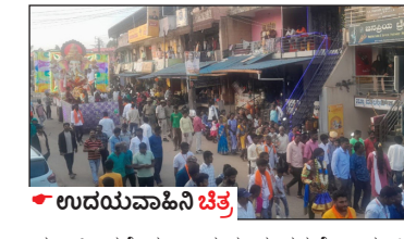
● ಉದಯವಾಹಿನಿ ಚಿತ್ರ

● ಉದಯವಾಹಿನಿ, ಶನಿವಾರಸಂತೆ ಸ್ಥಳೀಯ ಏಕದಂತ ಟ್ರಾಕ್ಟರ್ ಮಾಲೀಕರ ಸಂಘದ ವತಿಯಿಂದ ಕಳೆದ 62 ದಿನಗಳ ಹಿಂದೆ ಗೌರಿ ಗಣೇಶ ಹಬ್ಬದ ಪ್ರಯುಕ್ತ ಪಟ್ಟಣದ ಬೆಂಗಳೂರು ರಸ್ತೆ ಬಳಿ ಪ್ರತಿಷ್ಠಾಪಿಸಿದ್ದ ಗೌರಿ-ಗಣಪತಿ ಮೂರ್ತಿಯನ್ನು ಅದ್ದೂರಿ ಮೆರವಣಿಗೆಯೊಂದಿಗೆ ವಿಸರ್ಜನೆ ಮಾಡಲಾಯಿತು. ಏಕದಂತ ಟ್ರಾಕ್ಟರ್ ಮಾಲೀಕರ ಸಂಘದ ವತಿಯಿಂದ ಗೌರಿ, ಗಣೇಶ ಹಬ್ಬದ ಪ್ರಯುಕ್ತ ಬೃಹತ್ ಮೆರವಣಿಗೆಯಲ್ಲಿ 12 ಅಡಿ ಅತೀವ ದೀಪಾಪತಿ ಮೂರ್ತಿಯನ್ನು ಪ್ರತಿಷ್ಠಾಪಿಸಲಾಗಿತ್ತು. ಇಲ್ಲಿ ಪ್ರತಿದಿನ ಪೂಜಾ ಕಾರ್ಯಗಳು ಹಾಗೂ ವಿಶೇಷ ಪೂಜೆಗಳನ್ನು ನಡೆಸಲಾಗುತ್ತಿತ್ತು. ಗೌರಿ, ಗಣಪತಿ ಮೂರ್ತಿಗೆ ವಿಶೇಷ ಪೂಜೆ ಹೋಮ ಕಾರ್ಯವನ್ನು ನೆರವೇರಿಸಲಾಯಿತು. ಸಂಜೆ ವಿಸರ್ಜನೆ ಮೆರವಣಿಗೆಯ ಸಲುವಾಗಿ ವಾಹನದಲ್ಲಿ ಮೈತ್ರಿ ದೀಪಗಳಿಂದ ಅಲಂಕಾರಿಸಿದ ಬೃಹತ್ ಮೆರವಣಿಗೆಯಲ್ಲಿ ಕ್ರೀಡಾ ಮೂಲಕ 12 ಅಡಿಯ ಗಣಪತಿ ಮೂರ್ತಿಯನ್ನು ಕೊರಿಸಲಾಯಿತು. ಸಂಜೆ 5ರಂತೆ ಗೌರಿ, ಗಣಪತಿ ವಿಸರ್ಜನೆ ಮೆರವಣಿಗೆಯ ಪಟ್ಟಣದ ತೆರನೂರು ರಾಣಿ ಚೆನ್ನಮ್ಮ ವೃತ್ತದಿಂದ ಮೆರವಣಿಗೆ ಸಾಗಿತ್ತು.