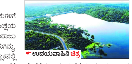
● ಉದಯವಾಹಿನಿ ಚಿತ್ರ

● ಉದಯವಾಹಿನಿ, ಬಂಗಾರಪೇಟೆ ಬಂಗಾರಪೇಟೆ ಸೇರಿದಂತೆ ಮೂರು ತಾಲ್ಲೂಕುಗಳಿಗೆ ಕುಡಿಯುವ ನೀರು ಪೂರೈಸುವ ಮಹತ್ವಾಕಾಂಕ್ಷಿಯ 'ಯರಗೋಳ್ ಜಲಾಶಯ' ದಿಂದ ಸರಬರಾಜು ಆಗುತ್ತಿರುವ ನೀರು ತಡದಲ್ಲಿ ಕಂದು ಬಣ್ಣಕ್ಕೆ ತಿರುಗಿದ್ದು ನಾಗರಿಕರು ಆತಂಕಕ್ಕೆ ಒಳಗಾಗಿದ್ದಾರೆ. ತಾಲ್ಲೂಕಿನಲ್ಲಿ ಯರಗೋಳ್ ಡ್ಯಾಂ ಕುಡಿಯುವ ನೀರಿನ ಯೋಜನೆಗೆ ಕಳೆದ ವರ್ಷ ನವೆಂಬರ್ ತಿಂಗಳಲ್ಲಿ ಮುಖ್ಯಮಂತ್ರಿ ಸಿದ್ದರಾಮಯ್ಯ ಜಾಲನ ನೀಡಿದ್ದರು. ಅಂದಿನಿಂದ ಈ ಜಲಾಶಯದ ನೀರನ್ನು ಪುರಸಭೆಯ ವತಿಯಿಂದ ಶುದ್ಧೀಕರಿಸಿ ಜನರಿಗೆ ಸರಬರಾಜು ಮಾಡಲಾಗುತ್ತಿದೆ. ಇದರಿಂದಾಗಿ ಪಟ್ಟಣದಲ್ಲಿ ಕುಡಿಯುವ ನೀರಿನ ಬವಣಿ ನೀಗಿದೆ. ಯರಗೋಳ್ ನೀರು ನೋಡುವ ಯಾವುದೇ ಕೆಲಸ ತಪ್ಪಾಗದಂತೆ ಕಾಣುತ್ತದೆ. ಆದರೆ ಬಹಳ ಅಥವಾ ಬಂದಿಗಳಲ್ಲಿ ಸಂಗ್ರಹಿಸಿದಾಗ ತಡದಲ್ಲಿ ನೀರು ಕಂದು ಬಣ್ಣಕ್ಕೆ ತಿರುಗಿದಂತೆ ಕಂಡುಬರುತ್ತದೆ. ಇದನ್ನು ಕಂಡು ನಾಗರಿಕರು ಗಾಬರಿಯಾಗಿದ್ದಾರೆ. ಅಲ್ಲದೆ, ಈ ನೀರನ್ನು ಸಂಗ್ರಹಿಸಿದಾಗ ಸಂಪದ್, ಸಿಂಚೆ ಸಹ ತಡದಲ್ಲಿ ಕಂದುಬಣ್ಣ ಕಂಡುಬರುತ್ತದೆ.