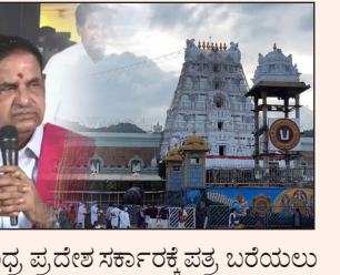
ತಿರುಮಲದಲ್ಲಿ ಕೆಲಸ ಮಾಡುತ್ತಿರುವ ಹಿಂದೂಯೇತರ ಬಗ್ಗೆ ಸೂಕ್ತ ನಿರ್ಧಾರ ತೆಗೆದುಕೊಳ್ಳುವಂತೆ ರಾಜ್ಯ ಸರ್ಕಾರಕ್ಕೆ ಪತ್ರ ಬರೆಯುತ್ತೇವೆ. ಟಿಟಿಡಿ ಹಿಂದೂ ಧಾರ್ಮಿಕ ಸಂಸ್ಥೆಯಾಗಿದ್ದು, ದೇವಸ್ಥಾನದಲ್ಲಿ ಕೆಲಸ ಮಾಡಲು ಹಿಂದೂಯೇತರರನ್ನು ನೇಮಿಸಿಕೊಳ್ಳಬಾರದು ಎಂದು ಮಂಡಳಿ ಅಭಿಪ್ರಾಯಪಟ್ಟಿದೆ. ಅವರನ್ನು ಬೇರೆ ಬೇರೆ ಇಲಾಖೆಗಳಲ್ಲಿ ಸೇರಿಸಿಕೊಳ್ಳಲು ಅಥವಾ ಅವರಿಗೆ ಸ್ವಯಂ ನಿವೃತ್ತಿ ಯೋಜನೆ ನೀಡಲು ನಾವು ಸರ್ಕಾರಕ್ಕೆ ಪತ್ರ ಬರೆಯುತ್ತೇವೆ

ಹೊಸದಾಗಿ ರಚನೆಯಾಗಿರುವ ತಿರುಮಲ ತಿರುಪತಿ ದೇವಸ್ಥಾನ ಮಂಡಳಿ ಉದ್ಯೋಗದಲ್ಲಿರುವ ಹಿಂದೂಯೇತರ ಹಿಂದೂ ಸ್ವಯಂ ನಿವೃತ್ತಿ ಪಡೆಯಕೋಳ್ಳಿ, ಇಲ್ಲವೇ ಕೊಡಲೇ ವರ್ಗಾವಣೆ ತೆಗೆದುಕೊಳ್ಳಿ ಎಂದು ತಿರುಮಲ ತಿರುಪತಿ ದೇವಸ್ಥಾನ ಅಡಕತೆ ಮಂಡಳಿ (ಟಿಟಿಡಿ) ನಿರ್ದೇಶಿಸಿದೆ.