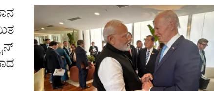
ಮಾತುಕೆ ನಡೆಸಿದವರು ಕುರಿತು ನರೇಂದ್ರ ಮೋದಿ ಅವರು ಟ್ವಿಟ್ ನಲ್ಲಿ ಭಾವಚಿತ್ರಗಳನ್ನು ಹಂಚಿಕೊಂಡಿದ್ದಾರೆ.

ರಿಯೋದಿಜಿನೈರೋ: ಜಿ-20 ಶೃಂಗಭವನ ವೇಳೆ ಪ್ರಧಾನ ಮಂತ್ರಿ ನರೇಂದ್ರ ಮೋದಿ ಅವರು ಅಮೆರಿಕದ ನಿರ್ಮಿತ ಅಧ್ಯಕ್ಷ ಜೋ ಬೈಡನ್, ಬ್ರೆಜಿಲ್, ಸಿಂಗಾಪುರ ಮತ್ತು ಸ್ವಿಟ್ಜರ್ ಲೆಂಡ್ನಿಂದ ವಿವಿಧ ವಿಶ್ವನಾಯಕರೊಂದಿಗೆ ಮಹತ್ವದ ಸಂವಾದ ನಡೆಸಿದರು.