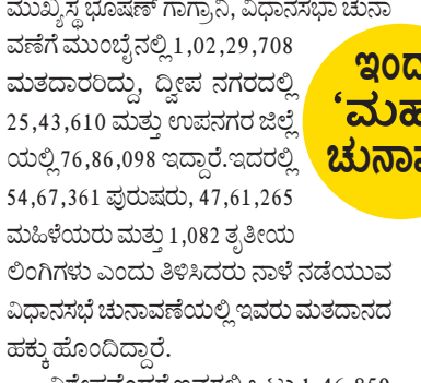
ಇಂದು 'ಮಹಾ' ಚುನಾವಣೆ

ಚುನಾವಣಾ ಅಧಿಕಾರಿಗಳ ಪ್ರಕಾರ ಹೊಸದಾಗಿ ಒಟ್ಟು 2.91 ಲಕ್ಷ ಮತದಾರರು ಸೇರ್ಪಡೆಯಾಗಿದ್ದಾರೆ. ಮುಂಬೈ ನಗರ ವ್ಯಾಪ್ತಿಯಲ್ಲಿ 36 ವಿಧಾನಸಭಾ ಕ್ಷೇತ್ರಗಳನ್ನು ಹೊಂದಿರುವ ಇದರಲ್ಲಿ 10 ದ್ವಿಪಕ್ಷ ನಗರದಲ್ಲಿ ಮತ್ತು 26 ಉಪನಗರ ಜಿಲ್ಲೆಯಲ್ಲಿವೆ. ಒಟ್ಟು 410 ಬೃಹತ್ ಮುಂಬೈ ಮುನ್ಸಿಪಲ್ ಕಾರ್ಪೊರೇಷನ್ ಮುಖ್ಯಸ್ಥ ಧೂಷಣ್ ಗಾನ್ಧಾನಿ, ವಿಧಾನಸಭಾ ಚುನಾವಣೆಗೆ ಮುಂಬೈನಲ್ಲಿ 1,02,29,708 ಮತದಾರರಿದ್ದು, ದ್ವಿಪಕ್ಷ ನಗರದಲ್ಲಿ 25,43,610 ಮತ್ತು ಉಪನಗರ ಜಿಲ್ಲೆಯಲ್ಲಿ 76,86,098 ಇದ್ದಾರೆ. ಇದರಲ್ಲಿ 54,67,361 ಪ್ರಭುಷು, 47,61,265 ಮಹಿಳೆಯರು ಮತ್ತು 1,082 ಕ್ಷತ್ರಿಯ ಲಿಂಗಿಗಳು ಎಂದು ತಿಳಿಸಿದರು ನಾಳೆ ನಡೆಯುವ ವಿಧಾನಸಭೆ ಚುನಾವಣೆಯಲ್ಲಿ ಇವರು ಮತದಾನದ ಹಕ್ಕು ಹೊಂದಿದ್ದಾರೆ.