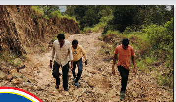
ನೇಪರ್ಕ ಇಲ್ಲ, ನಾಡಿಗೆ ಬಂದು ಕೂಲಿ ಮಾಡಿಕೊಂಡು ಮತ್ತೆ ಕಾಡಿಗೆ ಹೋಗಿ ಕುಟುಂಬ ಸೇರಬೇಕಾದ ಸ್ಥಿತಿ ಇದೆ.