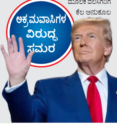
ಅಕ್ರಮವಾಸಿಗಳ ವಿರುದ್ಧ ಸಮರ

ಮಾಡಿ 'ನಿಜ' ಎಂದಿದ್ದರು. ಈ ಹಿಂದಿನ ಟ್ರಂಪ್ ಅಡಕತೆ ಅಧಿಯಲ್ಲಿ ಮೆಕ್ಸಿಕೊ ಗಡಿ ಭಾಗದ ಪ್ರದೇಶಗಳಲ್ಲಿ ಅಕ್ರಮ ವಲಸಿಗರ ಸಂಖ್ಯೆ ಹೆಚ್ಚಿತು. ಇದರಿಂದ ಸುಲಿಗೆ, ಅಪಹರಣ, ಕಾನೂನು ಬಾಹಿರ ಚಟುವಟಿಕೆಗಳ ಪ್ರಮಾಣ ಹೆಚ್ಚಾಗಿದೆ. 2023ರಲ್ಲಿ ಅಮೆರಿಕದ ಅಧ್ಯಕ್ಷ ಹೋರಾಟ ಬೈಡನ್ ಸಿಬಿಐ ಎಂಬ ಯೋಜನೆ ಮೂಲಕ ವಲಸಿಗರಿಗೆ ಕೆಲ ಅನುಕೂಲ