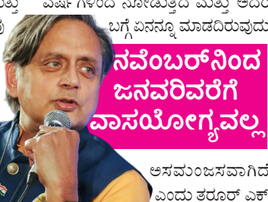
ನವೆಂಬರ್ನಿಂದ ಜನವರಿವರೆಗೆ ವಾಸಯೋಗ್ಯವಲ್ಲ

ಮತ್ತು ಕಟ್ಟುನಿಟ್ಟಾದ ಮಾನಿಟರಿಂಗ್ ಯಂತ್ರಣ ಕ್ರಮಗಳನ್ನು ಕೈಗೊಳ್ಳಲಾಗುತ್ತಿದೆ. ದೆಹಲಿಯ ಅಧಿಕಾರಿಗಳು ವಿಶ್ವದ ಅತ್ಯಂತ ಕಲುಷಿತ ನಗರವಾಗಿ ಮತ್ತು ಎರಡನೇ ಅತ್ಯಂತ ಕಲುಷಿತ ನಗರವಾದ ಧಾಕಾಕ್ಕಿಂತ ಸುಮಾರು ಐದು ಪಟ್ಟು ಕಟ್ಟುನಿಟ್ಟಾಗಿ. ನಮ್ಮ ಸರ್ಕಾರವು ಈ ದುಸ್ಥಿತಿಗಳನ್ನು ವರ್ಷಗಳಿಂದ ನೋಡುತ್ತಿದೆ ಮತ್ತು ಅದರ ಬಗ್ಗೆ ಏನನ್ನೂ ಮಾಡಿರುವುದು