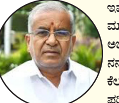
ಹಿಂಗಾರು ಹಂಗಾಮಿನಲ್ಲಿ ಮಳೆ ಕೊರತೆ