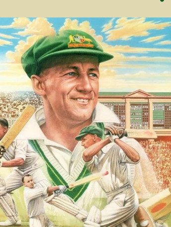
ಅಂದಹಾಗೆ ಡಾನ್ ಬ್ರಾಡ್ಮನ್ ಕ್ರಿಕೆಟ್ ಇತಿಹಾಸ ಕಂಡಂತಹ ಸರ್ವಶ್ರೇಷ್ಠ ಬ್ಯಾಟ್ಸ್ಮನ್. ಆಸ್ಟ್ರೇಲಿಯಾ ಪರ 52 ಟೆಸ್ಟ್ ಗಳನ್ನಾಡಿದ್ದ ಬ್ರಾಡ್ಮನ್, 2 ತ್ರಿಶತಕ, 12 ದ್ವಿಶತಕ, 29 ಶತಕಗಳು ಮತ್ತು 13 ಅರ್ಧ ಶತಕಗಳೊಂದಿಗೆ 6996 ರನ್‌ಗಳನ್ನು ಗಳಿಸಿದ್ದಾರೆ. ಅಂದರೆ ಅವರ ಬ್ಯಾಟಿಂಗ್ ಸರಾಸರಿ 99.94 ಇತ್ತು. ಇದು ಕ್ರಿಕೆಟ್ ಇತಿಹಾಸದಲ್ಲಿ ಬ್ಯಾಟ್ ರೆಕಾರ್ಡ್‌ನಲ್ಲಿ ಗರಿಷ್ಠ ಕುಮಾರ್ ಗುಪ್ತಾ ಅವರಿಗೆ ಉಡುಗೊರೆಯಾಗಿ ನೀಡಿದ್ದರು. ಈ ಕ್ಯಾಪ್ ಅನ್ನು ಬೊನಾರ್ಮನ್ ಹರಾಜಿನಲ್ಲಿ ಡಲಹಾಗೆ ಇದೀಗ 2.63 ಕೋಟಿ ರೂ.ಗೆ ಮಾರಾಟವಾಗುವ ಮೂಲಕ ಕ್ರಿಕೆಟ್ ಇತಿಹಾಸದಲ್ಲಿ ದುಬಾರಿ ಮೊತ್ತಕ್ಕೆ ಹರಾಜಾದ ಕ್ರಿಕೆಟಿಗನ ವಸ್ತು ಎನಿಸಿಕೊಂಡಿದೆ.

ಕ್ರಿಕೆಟ್ ಆಂಗ್ಲದಲ್ಲಿ ಡಾನ್ ಎಂದು ಕರೆಸಿಕೊಂಡಿದ್ದ ಬ್ರಾಡ್ಮನ್ 2001ರಲ್ಲಿ ತಮ್ಮ 92ನೇ ವಯಸ್ಸಿನಲ್ಲಿ ನಿಧನರಾದರು. ಆದರೆ 20 ವರ್ಷಗಳ ತಮ್ಮ ಟೆಸ್ಟ್ ಕ್ರಿಯಾತ್ ನಲ್ಲಿ ನಿರ್ಮಿಸಿದ ದಾಖಲೆಗಳು ಇನ್ನೂ ಸಹ ಅವರನ್ನು ಅಜರಾಮರರನ್ನಾಗಿರಿಸಿದೆ. ಕ್ರಿಕೆಟ್ ದಂತಕಥೆ ಡಾನ್ ಬ್ರಾಡ್ಮನ್ ಅವರ ಬ್ಯಾಟಿಂಗ್ ಕ್ಯಾಪ್ ಹತ್ತೇ ಹತ್ತು ನಿಮಿಷಗಳಲ್ಲಿ ಬರೋಬ್ಬರಿ 2.63 ಕೋಟಿ ರೂ.ಗೆ ಹರಾಜಾಗಿದೆ. ಸಿಡ್ನಿಯಲ್ಲಿ ನಡೆದ ಹರಾಜು ಕಾರ್ಯಕ್ರಮದಲ್ಲಿ 1947-48ರ ಭಾರತ ವಿರುದ್ಧದ ಸರಣಿಯಲ್ಲಿ ಆಸ್ಟ್ರೇಲಿಯಾದ ಮಾಜಿ ಅಟಗಾರ ಡಾನ್ ಬ್ರಾಡ್ಮನ್ ಧರಿಸಿದ್ದ ಪ್ರಸಿದ್ಧ 'ಬ್ಯಾಟಿಂಗ್ ಗ್ರೀನ್' ಹರಾಜಾಗಿದೆ.