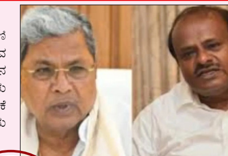
ನನ್ನ ತಪ್ಪಿದ್ದರೆ ರಾಜೀನಾಮೆ ಕೊಡುವೆ ಎಂಬ ಸಚಿವರ ಹೇಳಿಕೆ

ಉದಯವಾಹಿನಿ ಬೆಂಗಳೂರು ರಾಜ್ಯದ ಸರ್ಕಾರಿ ಆಸ್ಪತ್ರೆಗಳಲ್ಲಿ ಬಾಣಂತಿಯರ ಸರಣಿ ಸಾವಿನ ಬಗ್ಗೆ ತೀವ್ರ ಕಳವಳ ವ್ಯಕ್ತಪಡಿಸಿರುವ ಕೇಂದ್ರ ಸಚಿವ ಹೆಚ್.ಡಿ.ಕುಮಾರಸ್ವಾಮಿ ಅವರು, ಈ ಬಗ್ಗೆ ಹೈಕೋರ್ಟ್ ನ ಹಾಲಿ ನ್ಯಾಯಮೂರ್ತಿಗಳಿಂದ ಸಮಗ್ರ ತನಿಖೆ ಮಾಡಿಸಬೇಕು ಎಂದು ಒತ್ತಾಯಿಸಿದ್ದಾರೆ. ಈ ಕುರಿತು ಮಾಧ್ಯಮ ಹೇಳಿಕೆ ಬಿಡುಗಡೆ ಮಾಡಿರುವ ಅವರು, ಕಳವಳ ಔಷಧ ಪೂರೈಕೆ ವಿಷಯ ಸರ್ಕಾರದ ಗಮನಕ್ಕೆ ಬಂದಿರಲಿಲ್ಲವೇ ಅರೋಗ್ಯ ಸಚಿವ ದಿನೇಶ್ ಗುಂಡೂರಾವ್ ಅವರಿಗೆ ಈ ಮಾಹಿತಿ ಇರಲಿಲ್ಲವೇ ಎಂದು ಪ್ರಶ್ನಿಸಿದ್ದಾರೆ. ಪ್ರಗತಿಪರ ರಾಜ್ಯ ಕರ್ನಾಟಕದಲ್ಲಿ ಈ ವರ್ಷ 327 ಬಾಣಂತಿಯರು ಆಸ್ಪತ್ರೆಗಳಲ್ಲಿ ಸಾವನ್ನಪ್ಪಿದ್ದಾರೆ. ಸತ್ಯ ಅರೋಗ್ಯ ಸಚಿವ ದಿನೇಶ್ ಗುಂಡೂರಾವ್ ಅವರೇ ನೀಡಿರುವ ಈ ಮಾಹಿತಿ ನನಗೆ ಅಭಾಶಂಪೆಯೆನಿಸಿತು. ವೈದ್ಯ ಕ್ಷೇತ್ರದಲ್ಲಿ ಅಗಾಧ ಮುನ್ನಡೆ ಸಾಧಿಸಿರುವ ಈ ಕಾಲದಲ್ಲಿಯೂ ಮಹಿಳೆಯರು ಆಸ್ಪತ್ರೆಗಳಲ್ಲಿಯೇ ಜೀವ ತೆತ್ತುತ್ತಿರುವುದು ವಿಶ್ವಾಸದಿಂದ ತೆರಳುವ ಗೃಹಲಕ್ಷ್ಮಿಯರ ಜೀವನಮೇಲೆ ಮರಳಿ ಮನಗಾಲು ಬರುವಂತಹ ಗಾಂಧಿಯವರ ಇಲ್ಲ. ಇದೇನೂ ಮಹಿಳೆ ಹೇಳಿದ್ದಾರೆ. ಮಹಿಳೆಯರಿಗೆ ಗೃಹಲಕ್ಷ್ಮಿ ಗ್ಯಾರಂಟಿ ಕೊಟ್ಟು ಅವರನ್ನು ಅರ್ಥಿಕವಾಗಿ ಸಬಲೀಕರಣ ಮಾಡುತ್ತಿದ್ದೇವೆ ಎನ್ನುವ ರಾಜ್ಯ ಕಾಂಗ್ರೆಸ್ ಸರ್ಕಾರ, ಆಸ್ಪತ್ರೆಗಳಲ್ಲಿ ಅದೇ ಗೃಹಲಕ್ಷ್ಮಿಯರ ಜೀವಹರಣೆ ಮಾಡುತ್ತಿದೆ. ಮಗುವಿಗೆ ಜನ್ಮ ನೀಡಲು ಸರ್ಕಾರಿ ಆಸ್ಪತ್ರೆಗೆ ವಿಶ್ವಾಸದಿಂದ ತೆರಳುವ ಗೃಹಲಕ್ಷ್ಮಿಯರ ಜೀವನಮೇಲೆ ಮರಳಿ ಮನಗಾಲು ಬರುವಂತಹ ಗಾಂಧಿಯವರ ಇಲ್ಲ. ಇದೇನೂ ಮಹಿಳೆ ಹೇಳಿದ್ದಾರೆ.