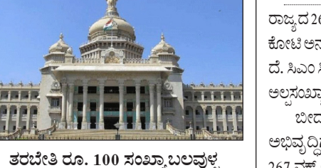
ಉದಯವಾಹಿನಿ ಚಿತ್ರ ತರಬೇತಿ ರೂ. 100 ಸಂಖ್ಯಾ ಬಲವುಳ್ಳ 96 ಮೆಟ್ರೋ ನಂತರದ ಬಾಲಕ / ಬಾಲಕಿಯರ ವಿಧ್ಯಾರ್ಥಿ ನಿಲಯಗಳು ಪ್ರಾರಂಭ

ಉದಯವಾಹಿನಿ ಬೆಂಗಳೂರು ರಾಜ್ಯದ 267 ವಕ್ ಆಸ್ತಿಗಳ ಸಂರಕ್ಷಣೆ, ಅವುಗಳ ಅಭಿವೃದ್ಧಿಗಾಗಿ ರೂ.22.87 ಕೋಟಿ ಅನುದಾನ ನೀಡಲು ರಾಜ್ಯ ಸಚಿವ ಸಂಪೂರ್ಣ ಸಭೆಯಲ್ಲಿ ನಿರ್ಧರಿಸಲಾಗಿದೆ. ಸಿಎಂ ಸಿದ್ಧರಾಮಯ್ಯ ನೇತೃತ್ವದಲ್ಲಿ ನಡೆದ ಸಚಿವ ಸಂಪೂರ್ಣ ಸಭೆಯಲ್ಲಿ ಅಲ್ಪಸಂಖ್ಯಾತ ಸಮುದಾಯಕ್ಕೆ ಮಹತ್ವದ ಯೋಜನೆಗಳನ್ನು ಘೋಷಿಸಲಾಗಿದೆ. ಬೀದರ್‌ನಲ್ಲಿರುವ ಶ್ರೀ ನಾನಕ್ ಝೀರಾ ಸಾಹೇಬ್ ಗುರುದ್ವಾರದ ಅಭಿವೃದ್ಧಿಗಾಗಿ ರೂ.1 ಕೋಟಿ ಅನುದಾನ ಮಂಜೂರು ಮಾಡಲಾಗಿದೆ. 267 ವಕ್ ಆಸ್ತಿಗಳ ಸಂರಕ್ಷಣೆ ಮತ್ತು ಅವುಗಳ ಅಭಿವೃದ್ಧಿಗಾಗಿ ರೂ.22.87 ಕೋಟಿ ಅನುದಾನ ನೀಡಲು ಒಪ್ಪಿಗೆ ನೀಡಲಾಗಿದೆ. ಅಲ್ಪಸಂಖ್ಯಾತ ಸಮಗ್ರ ಅಭಿವೃದ್ಧಿಗಾಗಿ ರೂ.231.81 ಕೋಟಿ ವೆಚ್ಚದಲ್ಲಿ ಕಾರ್ಯಕ್ರಮಗಳನ್ನು ಹೊಸ ಯೋಜನೆಗಳನ್ನು ಘೋಷಿಸಲಾಗಿದೆ.