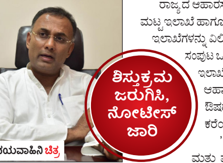
ಶಿಸ್ತುಕ್ರಮ ಜರುಗಿಸಿ, ನೋಟೀಸ್ ಜಾರಿ

ಉದಯವಾಹಿನಿ ಬೆಂಗಳೂರು ರಾಜ್ಯದಲ್ಲಿ ಈ ವರ್ಷ ರಾಜ್ಯದಲ್ಲಿ 327 ಬಾಣಂತಿಯರು ಮೃತಪಟ್ಟಿದ್ದಾರೆ ಎಂದು ಆರೋಗ್ಯ ಸಚಿವ ದಿನೇಶ್ ಗುಂಡೂರಾವ್ ಶಾಕಿಂಗ್ ಮಾಡಿ ಬಿಚ್ಚಿಟ್ಟಿದ್ದಾರೆ. ರಾಜ್ಯದಲ್ಲಿ ಈ ವರ್ಷ 327 ಮಹಿಳೆಯರು ಮೃತ ಪಟ್ಟಿದ್ದಾರೆ. ಈ ಸಂಬಂಧ ಕರ್ನಾಟಕ ಶಿಸ್ತುಕ್ರಮ ಜರುಗಿಸಿ, ನೋಟೀಸ್ ಜಾರಿ ಮಾಡಲಾಗಿದೆ ಎಂದು. ವಿಧಾನಸಭೆಯಲ್ಲಿ ಮುಖ್ಯಮಂತ್ರಿಗಳಾದ ಸಿದ್ಧರಾಮಯ್ಯ ಅವರ ಸೇತೃತ್ವದಲ್ಲಿ ನಡೆದ ಸಚಿವ ಸಂಪೂರ್ಣ ಸಭೆಯಲ್ಲಿ ಆರೋಗ್ಯ ಮತ್ತು ಕುಟುಂಬ ಕಲ್ಯಾಣ ಇಲಾಖೆ ಮತ್ತು ದಕ್ಷಿಣ ಕನ್ನಡ ಜಿಲ್ಲೆಯ ಅಭಿವೃದ್ಧಿ ಸಂಬಂಧಿಸಿದಂತೆ ಮಹತ್ವದ ನಿರ್ಣಯಗಳನ್ನು ತೆಗೆದುಕೊಳ್ಳಲಾಗಿದೆ ಎಂದು ಮಾಹಿತಿ ನೀಡಿದರು.