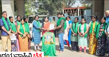
• ಉದಯವಾಹಿನಿ ಚಿಕ್ಕೋರಿ