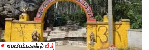
• ಉದಯವಾಹಿನಿ ಚಿಕ್ಕೋರಿ