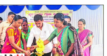
• ಉದಯವಾಹಿನಿ ಚಿಕ್ಕೋರಿ