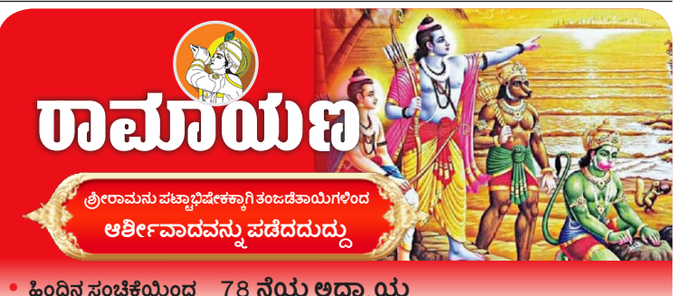
ಶ್ರೀರಾಮನು ಪಟ್ಟಾಭಿಷೇಕಕ್ಕಾಗಿ ತೆರಳುತ್ತಿರುವಾಗ