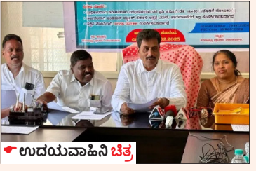
• ಉದಯವಾಹಿನಿ ಚಿತ್ರ

ನಿವೇಶನಕ್ಕೆ 6,69,810 ರೂ. ಮೌಲ್ಯ ನಿಗದಿ ಮಾಡಿದ್ದು ಶೇ. 10ರಷ್ಟು ಅಂದರೆ 66,980 ರೂ. ಗಳ ಪ್ರಾರಂಭಿಕ ಠೇವಣಿ, ನೊಂದಣಿ ಶುಲ್ಕವಾಗಿ 100 ರೂ. ಗಳನ್ನು ಪಾವತಿಸಬೇಕಿದೆ. 9.0 ಮೀ X 15.0 ಮೀ ಅಳತೆಯ ನಿವೇಶನಕ್ಕೆ 18,15,750 ರೂ. ಮೌಲ್ಯ ನಿಗದಿ ಮಾಡಿದ್ದು ಶೇ. 10ರಷ್ಟು ಅಂದರೆ 1,81,575 ರೂ. ಗಳ ಪ್ರಾರಂಭಿಕ ಠೇವಣಿ, ನೊಂದಣಿ ಶುಲ್ಕವಾಗಿ 250 ರೂ. ಗಳನ್ನು ಪಾವತಿಸಬೇಕಿದೆ. 12.0 ಮೀ X 18.0 ಮೀ ಅಳತೆಯ ನಿವೇಶನಕ್ಕೆ 29,05,200 ರೂ. ಮೌಲ್ಯ ನಿಗದಿ ಮಾಡಿದ್ದು ಶೇ. 10ರಷ್ಟು ಅಂದರೆ 2,90,520 ರೂ. ಗಳ ಪ್ರಾರಂಭಿಕ ಠೇವಣಿ, ನೊಂದಣಿ ಶುಲ್ಕವಾಗಿ 500 ರೂ. ಗಳನ್ನು ಪಾವತಿಸಬೇಕಿದೆ. ಅರ್ಜಿ ಶುಲ್ಕ 500 ರೂ.ಗಳಾಗಿದೆ ಎಂದು ಅವರು ತಿಳಿಸಿದರು.