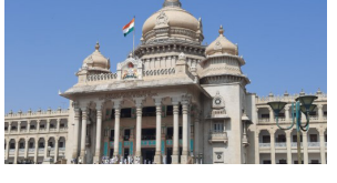
ಮಾನ್ಯ ಆಯೋಗವು ನಮೂನೆ-01 02

ನೇರ ನೇಮಕಾತಿ ಮತ್ತು ಪ್ರಾಥಮಿಕ ಶಾಲಾ ಶಿಕ್ಷಕರಿಗೆ ಪ್ರೌಢಶಾಲಾ ಸಹ ಶಿಕ್ಷಕರ ಹುದ್ದೆಗೆ ಮುಂಬಡ್ಡಿ ನೀಡುವ ಸಮಯದಲ್ಲಿ ಪರಿಶಿಷ್ಟ ಜಾತಿ ಮತ್ತು ಪರಿಶಿಷ್ಟ ಪಂಗಡಗಳ ಹಿಂಜಾರಿ (ಬ್ಯಾಕ್ ಲಾಗ್) ಹುದ್ದೆಗಳನ್ನು ಗುರುತಿಸುವ ಬಗ್ಗೆ ಸರ್ಕಾರ ಆದೇಶ ಹೊರಡಿಸಿದೆ. ಏನಿದೆ ಆದೇಶದಲ್ಲಿ... ವಿಷಯಕ್ಕೆ ಸಂಬಂಧಿಸಿದಂತೆ, ಉಲ್ಲೇಖ(01) ರ ಪತ್ರದಲ್ಲಿ ಬ್ಯಾಕ್ ಲಾಗ್ ಸಹಜ ಸಂಪೂರ್ಣ ಉಪ ಸಮಿತಿ ಸಭೆಯ ನಿರ್ಣಯದಂತೆ, ಸರ್ಕಾರದ ವಿವಿಧ ಇಲಾಖೆಗಳು/ನಿಯಮಗಳು/ ಮಂಡಳಿಗಳು/ವಿವಿಧ ನಿಯಮಗಳು/ಸಹಕಾರ ಸಂಸ್ಥೆಗಳು/ಅನುದಾನಿತ ಶಿಕ್ಷಣ ಸಂಸ್ಥೆಗಳಿಗೆ ಭೇಟಿ ನೀಡಿದ ನೇರ ನೇಮಕಾತಿ, ಮುಂಬಡ್ಡಿಯಲ್ಲಿ 1978 ರಿಂದ ಬ್ಯಾಕ್ ಲಾಗ್ ಹುದ್ದೆಗಳನ್ನು ಗುರುತಿಸಲು ತನಿಖಾ ತಂಡವನ್ನು ರಚಿಸಲಾಗುತ್ತದೆ. ಶಾಲಾ ಶಿಕ್ಷಣ ಇಲಾಖೆ ಸೇರಿದಂತೆ, ಇತರ ಇಲಾಖೆಗಳಿಗೆ ಸಂಬಂಧಿಸಿದಂತೆ ಸರ್ಕಾರದಿಂದ ಕಾಲಕಾಲಕ್ಕೆ ಹೊರಡಿಸಿರುವ ಮೀಸಲಾತಿ ನಿಯಮಗಳನ್ವಯ