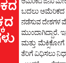
ಅಮೆರಿಕದ ಅಧಿಕಾರದ ದೇಶಗಳು ತ್ರೇಲ್

ಅವರು ಹೊಸ ತೆರಿಗೆ ನಿಯಮ ಘೋಷಣೆ ಮಾಡಿ, ಕೆನಡಾ, ಮೆಕ್ಸಿಕೋ ಚೀನಾ ವಿರುದ್ಧ ಹೆಚ್ಚಿನ ಸುಂಕ ವಿಧಿಸುವ ಸಾಧ್ಯತೆ ಇದೆ. ಹೀಗಾಗಿದ್ದು ಕೆನಡಾ ಪ್ರಧಾನಿ ಜಸ್ಟಿನ್ ಟ್ರೋ ಕೂಡ ಅಮೆರಿಕ ಮೊದಲು ಘೋಷಣೆಯನ್ನು ಮಾಡಲಿ, ಆ ಬಳಿಕ ನಾವು ಕೂಡ ನಮ್ಮ ನಿರ್ಧಾರ ತಿಳಿಸುತ್ತೇವೆ ಎಂಬ ಪ್ರತಿಕ್ರಿಯೆ ನೀಡಿದ್ದಾರೆ. ಮೆಕ್ಸಿಕೋ ಕೂಡ ಟ್ರಂಪ್ ಆಡಳಿತದ ಜೊತೆಗೆ ಚೀನಾ ನಡವಳಿಯನ್ನು ಅಂತಿಮಗೊಳಿಸಲು ನಿರೀಕ್ಷಿಸುತ್ತಿದ್ದಾರೆ. ಜಾಗತಿಕ ಮಟ್ಟದಲ್ಲಿ ಈ ವಿಚಾರ ದೊಡ್ಡ ಸದ್ದು ಮಾಡುತ್ತಿದೆ.