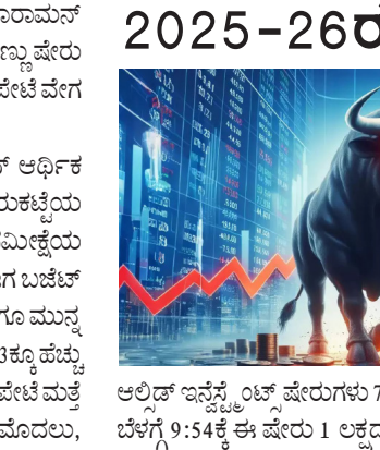
ಅಲ್ಪದ್ ಇನ್ಫ್ಲೇಷನ್ ಷೇರುಮಾರುಕಟ್ಟೆಗೆ ಒತ್ತು ನೀಡಲಿದೆ.

ಮೊಬಾಟು ನಡವುತ್ತಿದೆ. ಕಳೆದ 10 ವರ್ಷಗಳಲ್ಲಿ ಒಟ್ಟು 14 ಬಜೆಟ್ ಗಳನ್ನು ಮಂಡಿಸಲಾಗಿದೆ. ಬಜೆಟ್ ದಿನದಂದು 8 ಬಾರಿ ಷೇರು ಮಾರುಕಟ್ಟೆ ಕುಸಿದಿದೆ. ಆದರೆ ಷೇರು ಮಾರುಕಟ್ಟೆ ಬಾರಿ ಏರಿಕೆ ಕಂಡಿದೆ. 2024-25 ರ ಅರ್ಥಿಕ ಸಮೀಕ್ಷೆಯ ಪ್ರಸ್ತುತಿಯ ನಂತರ, ಷೇರು ಮಾರುಕಟ್ಟೆಯಲ್ಲಿ ಮಧ್ಯಾಹ್ನದ ವಲಯವನ್ನು ನಿರೀಕ್ಷಿಸಲಾಗಿದೆ. ಮೊಬಾಟು ನಡವುತ್ತಿದೆ ಮತ್ತು ಷೇರು ಮಾರುಕಟ್ಟೆಯಲ್ಲಿ ಏರಿಕೆ ಕಂಡು ಬಂದಿದೆ. ಆಗ ಬಜೆಟ್ ನಂತರವೂ ಜನ ಏರಿಕೆಯ ನಿರೀಕ್ಷೆಯಲ್ಲಿದ್ದಾರೆ. ಬಜೆಟ್‌ಗೂ ಮುನ್ನ ಷೇರುಮಾರುಕಟ್ಟೆಯಲ್ಲಿ ಭಾರಿ ಏರಿಕೆ ಕಂಡುಬಂದಿದೆ. ಸೆನ್ಸೆಕ್ಸ್ 253 ಕ್ಕೂ ಹೆಚ್ಚು ಅಂಕಗಳಿಗೇರಿತು. ಮೊದಲ ಸರ್ಕಾರದ ಬಜೆಟ್‌ನಿಂದ ಷೇರುಮಾರುಕಟ್ಟೆ ಮತ್ತು ವೇಗ ಪಡೆಯಲಿದೆ ಎಂದು ನಿರೀಕ್ಷಿಸಲಾಗಿದೆ. ಬಜೆಟ್ ಮೊದಲು,