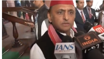
ಬಜೆಟ್ ಮಂಡನೆ ಮಾಡಲಾಗುತ್ತಿದೆ ಎಂದು ಗದ್ದುಗೆ ಎಬ್ಬಿಸಿದರು.

ನವದೆಹಲಿ: ಕೇಂದ್ರ ಸರ್ಕಾರವು ಜನ ವಿರೋಧಿ ಬಜೆಟ್ ಮಂಡನೆ ಮಾಡುವುದನ್ನು ವಿರೋಧಿಸಿ ವಿಪಕ್ಷಗಳು ಕಲಾಪದಿಂದ ಹೊರ ನಡೆದ ಘಟನೆ ಲೋಕಾರ್ಪಣೆ ಯಲ್ಲಿ ನಡೆಯಿತು. ಬೆಳಿಗ್ಗೆ 11 ಗಂಟೆಗೆ ಸಭೆಯಾಗಿ ಹೇಳಿಕಾರು ಸಚಿವ ನಿರ್ಮಲಾ ಸೀತಾರಾಮನ್ ಅವರು ಬಜೆಟ್ ಮಂಡಿಸಲು ಲೋಕಾರ್ಪಣೆ ಸ್ಥಳಕ್ಕೆ ಹೋಗಿ ಬಿರ್ಲಾ ಅವರು ಸೂಚನೆ ನೀಡಿದರು. ಈ ವೇಳೆ ತಮ ಆಸನದಿಂದ ಎದ್ದು ನಿಂತು ಬಜೆಟ್ ಪುಸ್ತಕ ಓದಲು ನಿರ್ಮಲಾ ಸೀತಾರಾಮನ್ ಮುಂದಾಗುತ್ತಿದ್ದಂತೆ ಪ್ರತಿ ವಿಪಕ್ಷಗಳ ಸದಸ್ಯರು ಸರ್ಕಾರದ ವಿರುದ್ಧ ಧಿಕ್ಕಾರದ ಘೋಷಣೆಗಳನ್ನು ಕೂಗಿ ಸದನದಿಂದ ಹೊರನಡೆದರು. ಇದು ಸಂಪೂರ್ಣವಾಗಿ ಜನ ವಿರೋಧಿ ಬಜೆಟ್. ಈ ಬಜೆಟ್ ನಿಂದ ಯಾವುದೇ ಜನರಿಗೂ ಅನುಕೂಲವಾಗಿಲ್ಲ. ಕೇವಲ ಕಾರ್ಪೊರೇಟ್ ಗಳು ಹಿತಾಸಕ್ತಿಯನ್ನು ಗಮನದಲ್ಲಿಟ್ಟುಕೊಂಡು