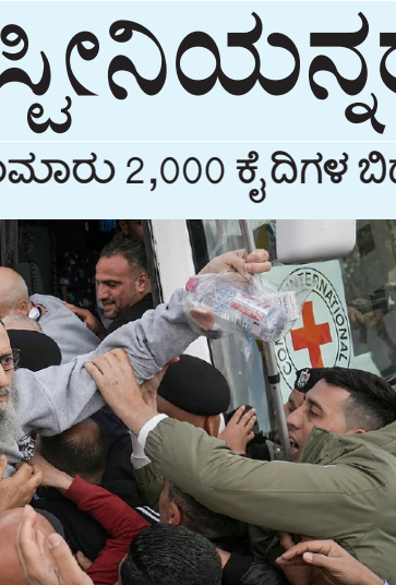
ಕದನ ವಿರಾಮ ಒಪ್ಪಂದ

ಮೊದಲ ಹಂತದಲ್ಲಿ 33 ಒತ್ತಾಯಗಳು ಮತ್ತು ಸುಮಾರು 2,000 ಕೈದಿಗಳ ಬಿಡುಗಡೆಗೆ ಒಪ್ಪಿಗೆ ನೀಡಲಾಗಿತ್ತು