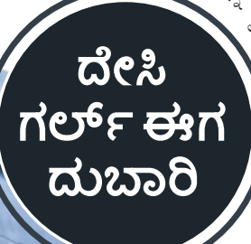
ದೇಸಿ ಗರ್ಲ್ ಈಗ ದುಬಾರಿ

ಪ್ರಿಯಾಂಕಾ ಚೋಪ್ರಾ ಅವರು ಹಿಂದಿ ಸಿನಿಮಾದಲ್ಲಿ ನಟಿಸಿದರೆ ಹಲವು ವರ್ಷಗಳೇ ಕಳೆದಿವೆ. ಹಾಲಿವುಡ್ ಸಿನಿಮಾಗಳಲ್ಲಿ ಆಯ್ಕೆವಾ ಆಗಿರುವ ನಟಿ ಈಗ ಮತ್ತೆ ಸೌತ್ ಸಿನಿಮಾಗೆ ಕಮ್ ಬ್ಯಾಕ್ ಮಾಡುತ್ತಿದ್ದಾರೆ. ರಾಜಮೌಳಿ ನಿರ್ದೇಶನದಲ್ಲಿ ಮಹೇಶ್ ಬಾಬು ಜೊತೆ ನಟಿಸಲು 30 ಕೋಟಿ ರೂ. ಸಂಭಾವನೆಯನ್ನು ನಟಿ ಡಿಮಾಂಡ್ ಮಾಡಿದ್ದಾರೆ ಎನ್ನಲಾದ ಸುದ್ದಿಯೊಂದು ಸೋಶಿಯಲ್ ಮೀಡಿಯಾದಲ್ಲಿ ಹರಿದಾಡುತ್ತಿದೆ. ಪ್ರಿಯಾಂಕಾಗೆ 42 ವರ್ಷವಾದರೂ ನಟಿಯ ಚಾರ್ಮ್ ಇನ್ನೂ ಕಮ್ಮಿಯಾಗಿಲ್ಲ. ಅವರಿಗೆ ಇನ್ನೂ ಬೇಡಿಕೆಯಿದೆ. ಹಾಲಿವುಡ್‌ನಲ್ಲಿ ಆಕ್ಟರ್ಸ್ ಕ್ಲಬ್ ಆಗಿ ಮಿಂಚುತ್ತಿದ್ದಾರೆ. ಹೀಗಿರುವಾಗ ಬಹುನಿರೀಕ್ಷಿತ ಸಿನಿಮಾ ರಾಜಮೌಳಿ ಮತ್ತು ಮಹೇಶ್ ಬಾಬು ಸಿನಿಮಾದಲ್ಲಿ ನಟಿಸಲು ಪ್ರಿಯಾಂಕಾ 30 ಕೋಟಿ ರೂ. ಕೇಳಿದ್ದಾರೆ. ಆದರೆ ಚಿತ್ರತಂಡ ಕೂಡ ಸಮ್ಮತಿ ಸೂಚಿಸಿದೆ ಎನ್ನಲಾದ ವಿಚಾರವೊಂದು ಚರ್ಚೆಗೆ ಗ್ರಾಸವಾಗಿದೆ. ಇನ್ನೂ ಭಾರತದ ಯಾವುದೇ ನಟಿ ಇಷ್ಟು ಸಂಭಾವನೆ ಪಡೆದಿಲ್ಲ. ಹಾಗಾಗಿ ಪ್ರಿಯಾಂಕಾ ಭಾರತದ ಅತ್ಯಂತ ಮೆಚಿದ ನಟಿ ಎನಿಸಿಕೊಂಡಿದ್ದಾರೆ. ಮಹೇಶ್ ಬಾಬು ಈ ಸಿನಿಮಾಗೆ ಕಳೆದ 2 ವರ್ಷಗಳಿಂದ ತಯಾರಿ ನಡೆಯುತ್ತಿದೆ. ಇತ್ತೀಚೆಗೆ ಈ ಚಿತ್ರದ ಮುಹೂರ್ತ ನೆರವೇರಿದೆ. ಸಿನಿಮಾದ ಶೂಟಿಂಗ್ ಕೂಡ ಶುರುವಾಗಿದೆ.