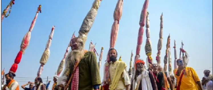
ಜೀವಮಾನದಲ್ಲಿ ಒಮ್ಮೆ ಸಿಗುವ ಅನುಭವ

ಪ್ರಯಾಗ್‌ರಾಜ್: ಉತ್ತರ ಪ್ರದೇಶದ ಪ್ರಯಾಗ್ ರಾಜ್‌ನಲ್ಲಿ ನಡೆಯುತ್ತಿರುವ ಮಹಾಕುಂಭ ಮೇಳವು ಜಗತ್ತಿನ ಗಮನ ಸೆಳೆದಿದೆ. ಮಹಾಕುಂಭ ಮೇಳದ ನಿರ್ಮಿತ ಸುಮಾರು 77 ದೇಶಗಳ ಸುಮಾರು 118 ರಾಜತಾಂತ್ರಿಕ ಸದಸ್ಯರ ನಿಯೋಗವು ಪ್ರಯಾಗ್‌ರಾಜ್‌ಗೆ ಭೇಟಿ ನೀಡಿದೆ. ಇವರಲ್ಲಿ ಸ್ಲೋವಾಕ್ ರಾಜ್ಯದ ಪ್ರಯಾಗ್‌ರಾಜ್ ವಿಮಾನ ನಿಲ್ದಾಣಕ್ಕೆ ಬಂದಿರುವ ಮಹಾಕುಂಭ ಮೇಳದಲ್ಲಿ ಭಾಗಿಯಾಗಿದ್ದಾರೆ.