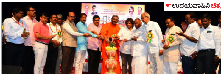
ಅತಿ ಹೆಚ್ಚು ಸಂಸ್ಕೃತಿ, ಕಲೆ, ವಿಭಿನ್ನವಾದ ಭಾಷೆ ಇದ್ದರೂ ಒಂದೇ ನೆಲದಲ್ಲಿ ಬಾಳುವ ದೇಶ ಭಾರತ. ಶಿಕ್ಷಣದ ಜತೆಗೆ ಕಲೆ, ನಮ್ಮ ಶ್ರೀಮಂತ ಸಂಸ್ಕೃತಿಯನ್ನು ಮುಂದಿನ ಪೀಳಿಗೆಗೆ ಕೊಂಡೊಯ್ಯುವ ಕೆಲಸ ಮಾಡಬೇಕು. ಪ್ರತಿಭಾ ಕಾರಂಜಿ, ಕಲೋತ್ಸವ ಕಾರ್ಯಕ್ರಮಗಳು ಇದಕ್ಕೆ ಸಹಕಾರಿಯಾಗಿವೆ - ಮಧು ಬಂಗಾರಪ್ಪ , ಶಿಕ್ಷಣ ಸಚಿವ

ವಿದ್ಯಾರ್ಥಿಗಳು ತಮ್ಮ ಶಿಕ್ಷಣದ ಜತೆಗೆ ದೇಶದ, ರಾಜ್ಯದ ಸಾಂಸ್ಕೃತಿಕ ರಾಯಭಾರಿಗಳಾಗಿ ಕಲೆ, ಸಂಸ್ಕೃತಿಯನ್ನು ಮುಂದಿನ ಪೀಳಿಗೆಗೆ ಕೊಂಡೊಯ್ಯುವ ಕೆಲಸ ಮಾಡಬೇಕು ಎಂದು ಪ್ರಾಥಮಿಕ ಮತ್ತು ಪ್ರೌಢ ಶಿಕ್ಷಣ ಸಚಿವರು ಮಧು ಬಂಗಾರಪ್ಪ ವಿದ್ಯಾರ್ಥಿಗಳಿಗೆ ಕರೆ ನೀಡಿದರು. ನಗರದ ಮುಂದುವರಿದು ಬೃಹದಾಚಾರ್ಯ ಬೃಹದಾಚಾರ್ಯ ಮಂಟಪದಲ್ಲಿ ಶಾಂತ ಶಿಕ್ಷಣ, ಸಾಕ್ಷರತೆ ಇಲಾಖೆ, ಜಿಲ್ಲಾಶಿಕ್ಷಣ, ಜಿಲ್ಲಾಪಂಚಾಯತ್, ಶಾಲಾ ಶಿಕ್ಷಣ ಇಲಾಖೆ ಇವರ ಸಂಯುಕ್ತವಾದ ಶ್ರಮದ ಫಲವಾಗಿ ಸಾಂಸ್ಕೃತಿಕ ಅಭಿವೃದ್ಧಿ ಅರಬ್ಬಿ ಎರಡು ದಿನಗಳ ರಾಜ್ಯ ಮಟ್ಟದ ಪ್ರತಿಭಾ ಕಾರಂಜಿ ಹಾಗೂ ಕಲೋತ್ಸವ ಕಾರ್ಯಕ್ರಮ ಉದ್ಘಾಟಿಸಿ ಅವರು ಮಾತನಾಡಿದರು.