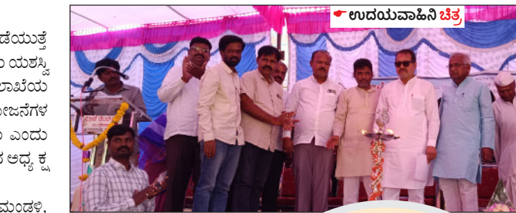
ಪುರಸಭೆ ನಗರಸಭೆ ಮೇಲ್ದರ್ಜೆಗೇರಿಸಲು ಪ್ರಸ್ತಾವನೆ. ಕೇಂದ್ರ ಪುರಸಭಾ ಅಮ್ಲತ್ 2.0 ಪಟ್ಟಣಕ್ಕೆ ಕುಡಿಯುವ ನೀರು ವಿತರಣಾ ಯೋಜನೆ ಹಂತ 1 ಕಾಮಗಾರಿಗೆ ಭೂಮಿಪೂಜೆ.