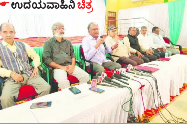
ರಾಜ್ಯ ಬ್ಯಾಂಕ್ ರಚನೆಗೆ ವೆಂಕಟೇಶ್ವರ ರೆಡ್ಡಿ ಕರೆ. ಗ್ರಾಮೀಣ ಬ್ಯಾಂಕ್ ಗಳು 12 ಪ್ರಯೋಜಿತ ಬ್ಯಾಂಕ್ ಗಳು ಒಂದು ಆಗುತ್ತವೆ. ಇದರಲ್ಲಿ ರಾಷ್ಟ್ರೀಯ ಬ್ಯಾಂಕ್ ಗಳು 11 ಮತ್ತು ರಾಜ್ಯ ಬ್ಯಾಂಕ್ ಆಗುತ್ತವೆ. ಇದರಲ್ಲಿ ರಾಜ್ಯ ಬ್ಯಾಂಕ್ ಗಳು 1 ಮತ್ತು ರಾಜ್ಯ ಬ್ಯಾಂಕ್ ಆಗುತ್ತವೆ.

ಈ ತಿಂಗಳ ಅಂತ್ಯದಲ್ಲಿ ಒಂದು ರಾಜ್ಯ ಒಂದು ಗ್ರಾಮೀಣ ಬ್ಯಾಂಕ್ ಗಳ ರಚನೆ ಕಾರ್ಯ ಆಗಲಿದೆ. ಇದರಿಂದ ಗ್ರಾಮೀಣ ಬ್ಯಾಂಕ್ ಗಳ 12 ಪ್ರಯೋಜಿತ ಬ್ಯಾಂಕ್ ಗಳು ಒಂದು ಆಗುತ್ತವೆ. ಇದರಲ್ಲಿ ರಾಷ್ಟ್ರೀಯ ಬ್ಯಾಂಕ್ ಗಳು 11 ಮತ್ತು ರಾಜ್ಯ ಬ್ಯಾಂಕ್ ಆಗುತ್ತವೆ. ಇದರಲ್ಲಿ ರಾಜ್ಯ ಬ್ಯಾಂಕ್ ಗಳು 1 ಮತ್ತು ರಾಜ್ಯ ಬ್ಯಾಂಕ್ ಆಗುತ್ತವೆ. ಇದರಲ್ಲಿ ರಾಜ್ಯ ಬ್ಯಾಂಕ್ ಗಳು 1 ಮತ್ತು ರಾಜ್ಯ ಬ್ಯಾಂಕ್ ಆಗುತ್ತವೆ.