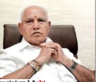
ನ್ಯಾಯಾಲಯ ಸಮನ್ ನೀಡಿತು. ಈ ಒಂದು ಸಮನ್ ಪ್ರತಿ ಬಿಎಸ್ ಯಡಿಯೂರಪ್ಪ ಹೈಕೋರ್ಟ್ ಮೆಟ್ಟಲು ಹೈಕೋರ್ಟ್ ಆಜಿಫ ವಿಚಾರಣೆ ನಡೆಸಿ, ಕಾಗ್ನಿಜ್ನ ಸಮನ್, ಆದೇಶಕ್ಕೆ ಹೈಕೋರ್ಟ್ ತಡೆ ನೀಡಿದೆ.

ಉದಯವಾಹಿನಿ, ಬೆಂಗಳೂರು, ಮಾಜಿ ಮುಖ್ಯಮಂತ್ರಿ ಬಿಎಸ್ ಯಡಿಯೂರಪ್ಪ ಅವರ ವಿರುದ್ಧ ಪೋಕ್ಸೋ ಪ್ರಕರಣಕ್ಕೆ ಸಂಬಂಧಪಟ್ಟಂತೆ ಮುದ್ದು ಹಾಜರಾತಿಗೆ ತಡೆ ನೀಡಿದ ವಿಶೇಷ ನ್ಯಾಯಾಲಯದ ಆದೇಶಕ್ಕೆ ಹೈಕೋರ್ಟ್ ತಡೆ ನೀಡಿದೆ.