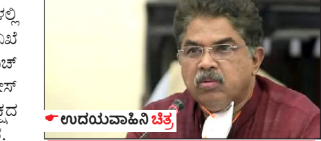
ಉದಯವಾಹಿನಿ ಚಿತ್ರ, ಶೇ.40 ಕಮಿಷನ್ ಆರೋಪ ನ್ಯಾ. ನಾಗಮೋಹನ್ ದಾಸ್ ಸಮಿತಿಯಿಂದ 20,000 ಪುಟಗಳ ವರದಿ ಸಲ್ಲಿಕೆ; ವಿಷಕರ ವಿರುದ್ಧ ಸರ್ಕಾರಕ್ಕೆ ಸಿಕ್ಕಿ ಹೊಸ ಅಸ್ಪೂಗಮೋಹನ್ ದಾಸ್ ಕಾಂಗ್ರೆಸ್ ಪರವಾಗಿ ವರದಿ ಸಲ್ಲಿಸುವ ಅಭ್ಯಾಸವಿದೆ.

ಉದಯವಾಹಿನಿ, ಬೆಂಗಳೂರು, ಬಿಜಿಪಿ ಅಧಿಕಾರಾವಧಿಯಲ್ಲಿ ಸಿಎಲ್ ಕಾಮಗಾರಿಗಳಲ್ಲಿ ಶೇ. 40ರಷ್ಟು ಕಮಿಷನ್ ಪಡೆದ ಅರೋಪದ ಕುರಿತು ತುಂಬಿ ನಡೆಸಲು ರಚಿಸಲಾಗಿದ್ದ ನಿವೃತ್ತ ನ್ಯಾಯಮೂರ್ತಿ ಎಂ.ಎಸ್. ನಾಗಮೋಹನ್ ದಾಸ್ ಆಯೋಗವನ್ನು ಕಾಂಗ್ರೆಸ್ ಪ್ರೇರಿತ ಆಯೋಗ ಎಂದು ವಿಧಾನಸಭೆ ಪ್ರತಿಪಕ್ಷದ ನಾಯಕ ಆರ್.ಅಶೋಕ ಗುರುವಾರ ಟೀಕಿಸಿದ್ದಾರೆ.