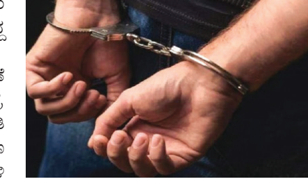
ಮೂವರು ಅರೋಪಿಗಳನ್ನು ಬಂಧಿಸಲಾಗಿದೆ. ಒಂದು ತೂಕದ ಗಾಂಜಾ ಮತ್ತು ಒಂದು ಡ್ರಿಬ್ಬಕ್ಟ್ ವಾಹನವನ್ನು ವಶಪಡಿಸಿಕೊಳ್ಳಲಾಗಿದೆ.

8 ರಂದು ನ್ಯೂ ಗುರಪ್ಪನಹಳ್ಳಿಯ ಬಿಟಿಎಂ ಲೇಔಟ್‌ನಲ್ಲಿರುವ ಮನೆಯಿಂದ ಮತ್ತೊಬ್ಬರನ್ನು ವಶಪಡಿಸಲಾಗಿದೆ. 1.8 ಲಕ್ಷ ರೂ. ಮೌಲ್ಯದ ಮೊದಕ ವಸ್ತು ವಶ