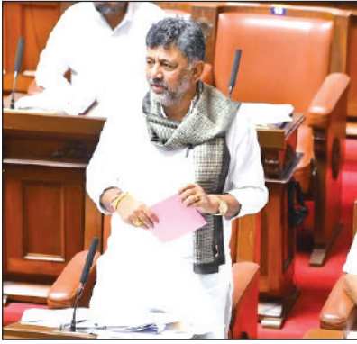
ನಷ್ಟ ಅನುಭವಿಸುತ್ತಿದ್ದ. ಹೀಗಾಗಿ ನಾವು ಕನಿಷ್ಠ ಪಕ್ಷ ಒಂದು ಪೈಸೆಯಾದರೂ ನೀರಿನ ದರ ಏರಿಕೆ ಮಾಡಲು ತೀರ್ಮಾನಿಸಿದ್ದೇವೆ.

ಉದಯವಾಹಿನಿ, ಬೆಂಗಳೂರು, ಈಗಾಗಲೇ ಬಿಎಂಟಿಸಿ, ಕೆಎಸ್ಆರ್‌ಟಿಸಿ ಹಾಗೂ ನಮ್ಮ ಮೆಟ್ರೋ ದರ ಏರಿಕೆಯಿಂದ ತತ್ತರಿಸಿರುವ ರಾಜಧಾನಿ ಬೆಂಗಳೂರಿನ ಜನತೆಗೆ ರಾಜ್ಯ ಸರ್ಕಾರ ಮತ್ತೊಂದು ದರ ಹೆಚ್ಚಳ ಶಾಕ್ ನೀಡಲು ಮುಂದಾಗಿದೆ.