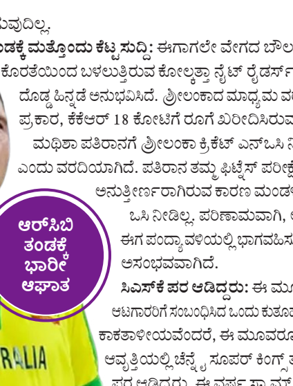
ಆರಿಸಿಬಿ ತಂಡಕ್ಕೆ ಭಾರೀ ಆಫರ್

ನಿಂದ ಹೊರಬಿದ್ದಿದ್ದಾರೆ. ಐಪಿಎಲ್ ಸೀಸನ್ 2026 ಇನ್ನೂ ಆರಂಭವಾಗಿಲ್ಲ. ಆದಾಗ್ಯೂ, ಹಲವು ತಂಡಗಳಿಗೆ ದೊಡ್ಡ ಆಫರ್ ಆಗಿದೆ ಎಂದು ಹೇಳಲಾಗಿದೆ.