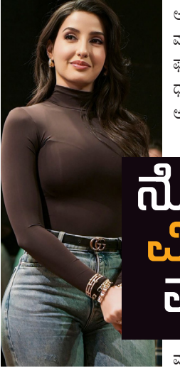
ಅಂತಹ ವಿಷಯಗಳಲ್ಲಿ ಭಾಗವಹಿಸುವುದು ಅಥವಾ ಪ್ರಚಾರ ಮಾಡುವುದು ಧಾರ್ಮಿಕ ತತ್ವಗಳಿಗೆ ವಿರುದ್ಧವಾಗಿದೆ ಎಂದು ಹೇಳಿದ್ದಾರೆ.

ಲೋಕಾರ್ಪಣೆ ಅಧಿವೇಶನದಲ್ಲಿಯೂ ಸಹ ಹಾಡಿನ ಕುರಿತು ಚರ್ಚೆ ಆಗಿದೆ. ಇದೀಗ ಉತ್ತರ ಪ್ರದೇಶದ ಮುಖ್ಯ ಭಾಷಾ ಸಂಸ್ಥೆಯ ಮೌಲ್ಯ ನೋರಾ ಫತೇಹಿ ವಿರುದ್ಧ ಫಿಲ್ಮ್ ಹೋರಾಡಿದ್ದಾರೆ. ಉತ್ತರ ಪ್ರದೇಶದ ಅಲಿಗಢದಲ್ಲಿರುವ ಮುಖ್ಯ ಪರ್ಸನಲ್ ದಾರುಲ್ ಇಸ್ಲಾಮ ಎಂಬ ಧಾರ್ಮಿಕ ಸಂಸ್ಥೆಯು ಬಾಲಿವುಡ್ ನಟ ಮತ್ತು ನೃತ್ಯಗಾರಿ ನೋರಾ ಫತೇಹಿ ವಿರುದ್ಧ ಫಿಲ್ಮ್ ಹೋರಾಡಿದೆ.