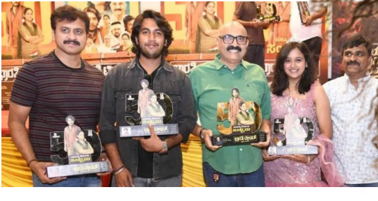
ಟೀಚರ್ 7ನೇ ತರಗತಿ' ಚಿತ್ರತಂಡಕ್ಕೆ ಅಭಿನಂದನೆ ತಿಳಿಸಿದರು.