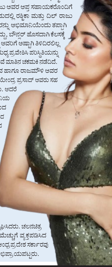
ನಟ ಆರ್ ನಾರಾಯಣ ಮೂರ್ತಿ ಎಂದು ತಪ್ಪಾಗಿ ಭಾವಿಸಿ, ಅದೇ ಹೆಸರಿನಿಂದ ಕರೆದರು. ಇದರಿಂದ ಬೇಸರಗೊಂಡ ವಿಜಯೇಂದ್ರ ಪ್ರಸಾದ್ ಅವರು ವೇದಿಕೆಯಿಂದ ಕೋಪದಿಂದಲೇ ನಿರ್ಗಮಿಸಿದರು ಎನ್ನಲಾಗಿದೆ.

ನಟ ರಶ್ಮಿಕಾ ಮಂದಣ್ಣ ಅವರ ವೈಯಕ್ತಿಕ ಬೌನ್ಸರ್ ಒಬ್ಬರು ತೆಲಂಗಾಣದ ಫಿಲ್ಮ್ ಡೆವಲಪ್ ಮೆಂಟ್ ಕಾರ್ಪೊರೇಷನ್ ಅಧ್ಯಕ್ಷ ದಿಲ್ ರಾಜು ಅವರ ಆಪ್ತ ಸಹಾಯಕರೊಂದಿಗೆ ಜಗಳ ಮಾಡಿದ್ದಾರೆ ಎಂದು ವರದಿಯಾಗಿದೆ.