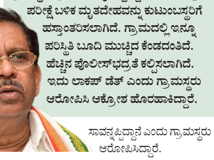
ಸಾವನ್ನಪ್ಪಿದ್ದಾರೆ ಎಂದು ಗ್ರಾಮಸ್ಥರು ಆರೋಪಿಸಿದ್ದಾರೆ.