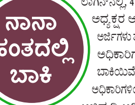
ನಾನಾ ಹಂತದಲ್ಲಿ ಬಾಕಿ

ಲಾಗಿನ್‌ನಲ್ಲಿ 4,036 ಅರ್ಜಿಗಳು ಗ್ರಾಮ ಪಂಚಾಯತಿ ಅಧ್ಯಕ್ಷರ ಅಧಿಕಾರವಾಗಿ ಲಾಗಿನ್‌ನಲ್ಲಿ 1,947 ಅರ್ಜಿಗಳು ತಾಲ್ಲೂಕು ಪಂಚಾಯತಿ ಕಾರ್ಯ ನಿರ್ವಹಣೆ ಅಧಿಕಾರಿಗಳ ಲಾಗಿನ್‌ನಲ್ಲಿ ಅನುಮೋದನೆಗಾಗಿ ಬಾಕಿಯಿವೆ. 950 ಅರ್ಜಿಗಳು ಕಾರ್ಯ ನಿರ್ವಹಣೆ ಅಧಿಕಾರಿಗಳಿಂದ ಅನುಮೋದನೆಗೊಂಡು ಪಂಚಾಯತ್ ಅಭಿವೃದ್ಧಿ ಅಧಿಕಾರಿಗಳ ಲಾಗಿನ್‌ನಲ್ಲಿವೆ. ಈ ರೀತಿ ನಾನಾ ಹಂತಗಳಲ್ಲಿ ಒಟ್ಟು 18,011 ಅರ್ಜಿಗಳು ಅನುಮೋದನೆಗಾಗಿ ಬಾಕಿಯಿವೆ, ಎಂದು ಮಾಹಿತಿ ನೀಡಿದ್ದಾರೆ. ಹೊರದೇಶದ ಅರ್ಜಿದಾರರಿಗೆ ಇ-ಸ್ವತ್ತು ತಂತ್ರಾಂಶದಲ್ಲಿ ಪಾರ್ಸೋಲ್ ಮೂಲಕ ಅರ್ಜಿ ಸಲ್ಲಿಸಲು, ಹೊಸ ಬಡಾವಣೆಗಳಿಗೆ ಇ-ಸ್ವತ್ತು ತಂತ್ರಾಂಶದಡಿ ಅರ್ಜಿ ಸಲ್ಲಿಸಲು ಅವಕಾಶವನ್ನು ಮುಂದಿನ 10 ದಿನದೊಳಗೆ ಕಲ್ಪಿಸಲಾಗುವುದು. ಸಾರ್ವಜನಿಕರು ಇ-ಸ್ವತ್ತು 2.0 ತಂತ್ರಾಂಶದ ಮೂಲಕ ಆನ್‌ಲೈನ್‌ನಲ್ಲಿ ಅರ್ಜಿ ಸಲ್ಲಿಸಲು, ಸಾರ್ವಜನಿಕರಿಗೆ ಅನುಕೂಲವಾಗುವಂತೆ ಮಾಡಲಾಗಿದೆ. ಬಾಪೋಜಿ ಸೇವಾ ಕೇಂದ್ರಗಳಲ್ಲಿ ಅರ್ಜಿ