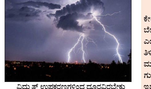
ವಿದ್ಯುತ್ ಉಪಕರಣಗಳಿಂದ ದೂರವಿರಬೇಕು

ಉದಯವಾಹಿನಿ, ಬೆಂಗಳೂರು ಕರ್ನಾಟಕದ ಕೆಲವು ಜಿಲ್ಲೆಗಳ ಶುಕ್ರವಾರ ವರುಣಾಭಿಷೆಕ್ ಒಳಗಾಗಲಿದೆ. ಕರಾವಳಿಯಲ್ಲಿ ಸುಡುಕು ಬಿಸಿಲು ಹಾಗೂ ತೇವಾಂಶ ಮುಂದುವರಿಯುತ್ತಿ, ಉಡುಪಿಯಲ್ಲಿ ಕೇವಲ ಗುಡುಗು ಮಂಚಿನ ಆಭಿಷಿ ಇರಲಿದೆ. 2 ದಿನ ಎಲ್ಲೆಲ್ಲಿ ಭಾರಿ ಮಳೆ?: ಪ್ರಮುಖವಾಗಿ ಉತ್ತರ ಒಳನಾಡಿನ ಜಿಲ್ಲೆಗಳಾದ ಧಾರವಾಡ, ಗದಗ, ಹಾವೇರಿ, ಕೊಪ್ಪಳ, ದಕ್ಷಿಣ ಒಳನಾಡಿನ ಜಿಲ್ಲೆಗಳಾದ ಬೆಂಗಳೂರು ನಗರ, ಬೆಂಗಳೂರು ಗ್ರಾಮಾಂತರ, ಚಿಕ್ಕಬಳ್ಳಾಪುರ, ಚಿಕ್ಕಮಗಳೂರು, ಚಿತ್ರದುರ್ಗ, ದಾವಣಗೆರೆ, ಮಂಡ್ಯ, ರಾಮನಗರ, ಶಿವಮೊಗ್ಗ, ತುಮಕೂರಿನಲ್ಲಿ ಅತಿ ಭಾರಿ ಮಳೆಯ ಮುನ್ಸೂಚನೆ ಹಿನ್ನೆಲೆ ಆರಂಜ್ ಅಲರ್ಟ್ ಕೊಡಲಾಗಿದೆ. ಎಲ್ಲೆಲ್ಲಿ ಸಾಧಾರಣ ಮಳೆ?: ಎಪ್ರಿಲ್ 30 ಗುರುವಾರದಂದು ತುಮಕೂರು, ಚಾಮರಾಜನಗರ, ಮೇ 1 ರಂದು ಚಿಕ್ಕಮಗಳೂರು, ಮೈಸೂರು, ಕೊಪ್ಪಳ, ಹಾಸನದಲ್ಲಿ ಸಾಧಾರಣ ಪ್ರಮಾಣದಲ್ಲಿ ಗುಡುಗು, ಆಲಿಕಲು ಮಳೆ, ಬಿರುಗಾಳಿ ಬರುವ ಕಾರಣಕ್ಕೆ ಯೆಲ್ಲೋ ಅಲರ್ಟ್ ಕೊಡಲಾಗಿದೆ.