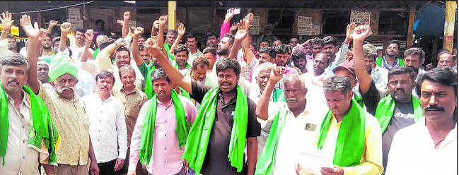
ಉದಯವಾಹಿನಿ ಚಿತ್ರ ನೆಪದಲ್ಲಿ ವ್ಯಾಪಾರಿಗಳನ್ನು ಸ್ವಲ್ಪದಿಂದ ಸ್ವಲ್ಪಾಂತರ ಸಂಚಾರ ದಟ್ಟಣೆಯ ನೆಪದಲ್ಲಿ ರೈತರು, ವ್ಯಾಪಾರಿಗಳಿಗೆ ನೀಡುತ್ತಿರುವ ಕಿರುಕುಳವನ್ನು ನಿಲ್ಲಿಸುವಂತೆ, ಸಂತೆಗೆ ಮೂಲಸೌಕರ್ಯಗಳನ್ನು ಒದಗಿಸುವಂತೆ ಆಗ್ರಹಿಸಿ ವಿವಿಧ ರೈತರ ಸಂಘಟನೆಗಳ ಕಾರ್ಯಕರ್ತರು ಕೆ.ಆರ್. ಪುರ ಸಂತೆ ಮೈದಾನದಲ್ಲಿ ಪ್ರತಿಭಟನೆ ನಡೆಸಿದರು. ಕೆ.ಆರ್. ಪುರ ಸಂತೆ ಮೈದಾನದಲ್ಲಿ ನಮ್ಮ ಪೂರ್ವಜರ ಕಾಲದಿಂದಲೂ ದೂರದ ಉರುಗಳಿಂದ ಹಣ್ಣು, ತರಕಾರಿ, ಹೂವು, ಕೃಷಿ ಉತ್ಪನ್ನಗಳನ್ನು ಹಳೆ ಮದ್ಯಾಸ ರಸ್ತೆ ಬದಿಯಲ್ಲಿ ವ್ಯಾಪಾರ ಮಾಡಲು ನಡೆಸಿಕೊಂಡು ಜನನಿರ್ವಹಣೆ ಮಾಡಲಾಗುತ್ತಿತ್ತು. ಆದರೆ ಇತ್ತೀಚಿನ ದಿನಗಳಲ್ಲಿ ಕೆ.ಆರ್. ಪುರ ಸಂಚಾರ ಪೊಲೀಸರು ರಸ್ತೆಯಲ್ಲಿ ವ್ಯಾಪಾರ ಮಾಡದಂತೆ ತೊಂದರೆ ನೀಡುತ್ತಿದ್ದಾರೆ ಎಂದು ಪ್ರತಿಭಟಿಸಲಾಗುತ್ತಿದೆ. ಅಧಿಕಾರಿಗಳಿಗೆ ಸಂತೆ ಮೈದಾನದಲ್ಲಿ ವ್ಯಾಪಾರ ಮಾಡದಂತೆ ತೊಂದರೆ ನೀಡುತ್ತಿದ್ದಾರೆ ಎಂದು ಪ್ರತಿಭಟಿಸಲಾಗುತ್ತಿದೆ. ಅಧಿಕಾರಿಗಳಿಗೆ ಸಂತೆ ಮೈದಾನದಲ್ಲಿ ವ್ಯಾಪಾರ ಮಾಡದಂತೆ ತೊಂದರೆ ನೀಡುತ್ತಿದ್ದಾರೆ ಎಂದು ಪ್ರತಿಭಟಿಸಲಾಗುತ್ತಿದೆ.