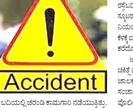
ರಸ್ತೆ ಬದಿಯಲ್ಲಿ ಚರಂಡಿ ಕಾಮಗಾರಿ ನಡೆಯುತ್ತಿತ್ತು.

ಉದಯವಾಹಿನಿ, ಬೆಂಗಳೂರು ಚಿಕ್ಕಜಾಲ ಸಂಚಾರ ಪೊಲೀಸ್ ಠಾಣಾ ವ್ಯಾಪ್ತಿಯಲ್ಲಿ ಆರಬ್ಬನವಂಗಳಿಂದ ಬಳಿ ಸ್ಕೂಟರ್ ನಿಯಂತ್ರಣ ತಪ್ಪಿ ಚರಂಡಿಗೆ ಉರುಳಿದ ಪರಿಣಾಮವಾಗಿ ಪತ್ನಿ ಸಾವು, ಪತಿ ಗಾಯಗೊಂಡಿರುವ ಘಟನೆ ರಾತ್ರಿ ನಡೆಯಿತು. ಅರಬ್ಬನವಂಗಳಿಂದ ನಿರೀಕ್ಷಿಸಿ ವ್ಯತಿರಿಕ್ತವಾಗಿ, ಅವರ ಪತಿ ಅನಿಲೆ ಗಾಯಗೊಂಡಿದ್ದು, ಆಹಾರಿಯಿಂದ ಪಾರಾಗಿದ್ದಾರೆ. ನೇತ್ರಾ ಅನಿಲೆ ದಂಪತಿ ಬಾಗಲೂರು ಸಂಚಿ ಸಂಚಿ ತೆರಳಿದ್ದರು. ಸಂತೆಯಲ್ಲಿ ವಿವಿಧ ಸಾಮಗ್ರಿ ಸಂಚಿ ರಾತ್ರಿ 7.30ರ ಸುಮಾರಿಗೆ ಮನೆಗೆ ಸ್ಕೂಟರ್‌ನಲ್ಲಿ ವಾಪಸ್ ಬರುತ್ತಿದ್ದರು. ಯಡಿಯೂರು ವರ್ಗದ ಅರಬ್ಬನವಂಗಳಿಂದ