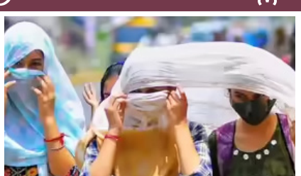
42 ಡಿಗ್ರಿಗಿಂತ ಹೆಚ್ಚು ತಾಪಮಾನ ದಾಖಲಾದ ಪ್ರದೇಶಗಳು

ಉದಯವಾಹಿನಿ, ಬೆಂಗಳೂರು ಕರ್ನಾಟಕದಲ್ಲಿ ಬಿಸಿಲಿನ ರುಚಿ ದಿನದಿಂದ ದಿನಕ್ಕೆ ಹೆಚ್ಚಾಗುತ್ತಿದ್ದು, ಉತ್ತರ ಕರ್ನಾಟಕ ಭಾಗದಲ್ಲಿ ಅತ್ಯಂತ ಸೂರ್ಯನ ಪ್ರಖರತೆಗೆ ಜನ ತತ್ತರಿಸಿದ್ದಾರೆ. ಕರ್ನಾಟಕ ರಾಜ್ಯ ನೈಸರ್ಗಿಕ ವಿಶೇಷ ಉಸ್ತುವಾರಿ ಕೇಂದ್ರ (ಕೆಎಸ್‌ಎನ್‌ಡಿಎಂ) ಏಪ್ರಿಲ್ 16 ರಂದು ಬಿಡುಗಡೆ ಮಾಡಿರುವ ವರದಿಯ ಪ್ರಕಾರ, ಬೀದರ್, ಕಲಬುರಗಿ ಜಿಲ್ಲೆಯಲ್ಲಿ ರಾಜ್ಯದ ಗರಿಷ್ಠ ತಾಪಮಾನ ದಾಖಲಾಗಿದೆ.