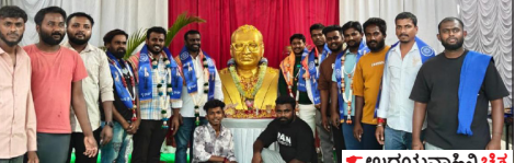
• ಉದಯವಾಹಿನಿ, ಕೆ.ಆರ್.ಪುರ