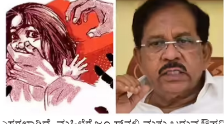
ವಸಗಲಾಗಿದೆ. ಮಹಿಳೆಗೆ ಜ್ಯೂಸ್‌ನಲ್ಲಿ ಮತ್ತು ಬರುವ ಔಷಧಿ ನೀಡಿ ಅತ್ಯಾಚಾರ ಎಸಗಲಾಗಿದೆ. ಪ್ರಕರಣಕ್ಕೆ ಸಂಬಂಧಿಸಿದಂತೆ ಜಾರ್ಖಂಡ್ ಮೂಲದ ವ್ಯಕ್ತಿಯೊಬ್ಬರನ್ನು ಬಂಧಿಸಲಾಗಿದೆ. ಅಲ್ಲದೆ, ಹೋಮ್‌ಸೈನ್ಸ್ ಮೇಲೆ ವಿಶೇಷ ಬಂಧನವೂ ಆಗಿದೆ. ಕೋರ್ಟ್‌ನಿಂದ ನೋಟಿಸ್ ಕೊಟ್ಟರಲ್ಲ, ನೋಟಿಸ್ ಬಂದಿದ್ದರೆ

ಕಾನೂನು ಪ್ರಕಾರ ಕ್ರಮ ತೆಗೆದುಕೊಳ್ಳುತ್ತಾರೆ ಎಂದು ತಿಳಿಸಿದರು. ಇಂತಹ ಘಟನೆಗಳಿಂದ ರಾಜ್ಯಕ್ಕಾಗಿ ಅಥವಾ ಸಮಾಜಕ್ಕಾಗಿ ಒಳ್ಳೆಯ ಸಂದೇಶ ಕೊಡುವುದಿಲ್ಲ.