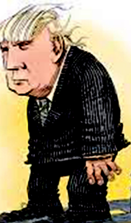
ಕದನ ವಿರಾಮ ಸಾಗಿಸಿದ ಪಾಕ್ ಟ್ರಂಪ್ ವಿಸ್ತರಿಸಿದ ಕದನ ವಿರಾಮವನ್ನು ಪಾಕಿಸ್ತಾನ ಪ್ರಧಾನಿ ಇಮ್ರಾನ್ ಖಾನ್ ಸ್ವೀಕರಿಸಿದ್ದಾರೆ. ಅಲ್ಲದೆ ರಾಜತಾಂತ್ರಿಕತೆಗೆ ಹೆಚ್ಚಿನ ಸಮಯವನ್ನು ನೀಡುವ ಪಾಕ್ ವಿನಂತಿಯನ್ನು ಸ್ವೀಕರಿಸಿದ ಕೆಲವು ಅಮೆರಿಕ ಅಧ್ಯಕ್ಷ ಟ್ರಂಪ್‌ಗೆ ಧನ್ಯವಾದ ಹೇಳಿದ್ದಾರೆ.

ಅಮೆರಿಕ ಉಪಾಧ್ಯಕ್ಷ ಜೆಡಿ ವ್ಯಾನ್ಸ್ ಮತ್ತು ಅಮೆರಿಕದ ವಿಶೇಷ ರಾಯಭಾರಿಗಳಾದ ಸ್ಟೀವ್ ವಿಟ್ಕೋ ಮತ್ತು ಜೇಡ್ ಕುಶ್ನರ್ ಇಸ್ಲಾಮಾಬಾದ್‌ಗೆ ತಾಂತ್ರಿಕ ಒಪ್ಪಂದದ ಮಾತುಕತೆಗೆ ತೆರಳಬೇಕೆಂದು, ಆದರೆ, ಪಾಕಿಸ್ತಾನ ಪ್ರಧಾನಿ ಇಮ್ರಾನ್ ಖಾನ್‌ನಿಂದ ತಡೆಗಟ್ಟಲಾಗಿದೆ.