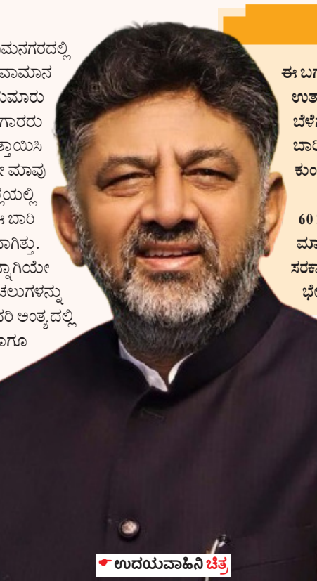
• ಉದಯವಾಹಿನಿ ಚಿತ್ರ

• ಉದಯವಾಹಿನಿ, ರಾಮನಗರ ರಾಜ್ಯದ ಪ್ರಮುಖ ಮಾವು ಬೆಳೆಯುವ ಜಿಲ್ಲೆಗಳಲ್ಲಿ ಒಂದಾದ ರಾಮನಗರದಲ್ಲಿ ಈ ಬಾರಿ ಮಾವು ಬೆಳೆಗಾರರ ಸ್ಥಿತಿ ಶೋಚನೀಯವಾಗಿದೆ. ಹವಾಮಾನ ವೈಪರೀತ್ಯ ಹಾಗೂ ಕೀಟ, ರೋಗಬಾಧೆಯಿಂದಾಗಿ ಜಿಲ್ಲೆಯ ಸುಮಾರು ಶೇ.50 ರಷ್ಟು ಮಾವು ಘಸಲು ನಷ್ಟವಾಗಿದ್ದು, ಮಾವು ಬೆಳೆಗಾರರು ಕಳೆದುಕೊಂಡು ಹೋಗಿದ್ದಾರೆ. ಈ ಹಿನ್ನೆಲೆಯಲ್ಲಿ ಸೂಕ್ತ ಪರಿಹಾರಕ್ಕಾಗಿ ಒತ್ತಾಯಿಸಿ ಸರ್ಕಾರದ ಮೊರೆ ಹೋಗಲು ಸಜ್ಜಾಗಿದ್ದಾರೆ. ರಾಜ್ಯದಲ್ಲಿಯೇ ಮಾವು ಬೆಳೆಯಲಿ ಎರಡನೇ ಸ್ಥಾನ ಗಳಿಸಿರುವ ಬೆಂಗಳೂರು ದಕ್ಷಿಣ ಜಿಲ್ಲೆಯಲ್ಲಿ 27 ಸಾವಿರ ಹೆಕ್ಟೇರ್ ಪ್ರದೇಶದಲ್ಲಿ ಮಾವು ಬೆಳೆಯಲಾಗುತ್ತದೆ. ಈ ಬಾರಿ ಅವಧಿಗೂ ಮೊದಲೇ ಮಾವಿನ ಮರಗಳಲ್ಲಿ ಹೂಬಿಡಲು ಶುರುವಾಗಿತ್ತು. ಡಿಸೆಂಬರ್ ತಿಂಗಳ ಕೊನೆಯ ವಾರದವರೆಗೂ ಫ್ಲವರಿಂಗ್ ಚೆನ್ನಾಗಿರುತ್ತೇ ಇತ್ತು. ಮರದ ತುಂಬಾ ಅರಳಿ ನಿಂತಿದ್ದ ಹೂವಿನ ಗೊಂಚಲೆಗಳನ್ನು ನೋಡಿ ಮಾವು ಬೆಳೆಗಾರರು ಸಂತಸವಾಗಿತ್ತು. ಆದರೆ ಜನವರಿ ಅಂತ್ಯದಲ್ಲಿ ಉಂಟಾದ ಹವಾಮಾನ ವೈಪರೀತ್ಯ, ಕೀಟ, ರೋಗಬಾಧೆ ಹಾಗೂ ತೆವಾಂಶದ ಕೊರೆತೆ ಎಲ್ಲರ ಲಕ್ಷಾಂತರವನ್ನು ಬುಡಮೇಲಾಗಿತ್ತು.