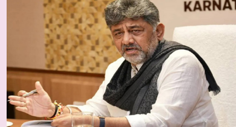
ಒಂದಾಗಿದೆ. ಎಚ್‌ಎಲ್ ವಿಮಾನ ನಿಲ್ದಾಣ ಬೆಂಗಳೂರಿನ ಹೃದಯ ಭಾಗದಲ್ಲಿದ್ದು, ಅಭಿವೃದ್ಧಿ ಕಾಮಗಾರಿಗಳ ಹೆಚ್ಚಿನ ಬೇಡಿಕೆ ಇದೆ. ಆದರೆ ಹೆಚ್ಚುವರಿಯಾಗಿ ವಿಧಿಸಲಾಗಿರುವ ನಿರ್ಬಂಧಗಳು ಈ ಪ್ರದೇಶಗಳಲ್ಲಿ ಅಭಿವೃದ್ಧಿಗೆ ಅಡ್ಡಿಯಾಗಿವೆ ಎಂದು ಪತ್ರದಲ್ಲಿ ವಿವರಿಸಿದ್ದಾರೆ. ಈ ವಿಚಾರವಾಗಿ ನಾಗರಿಕ ವಿಮಾನಯಾನ ಸಚಿವಾಲಯದ ಕಾರ್ಯದರ್ಶಿಗಳು, ರಕ್ಷಣಾ ಸಚಿವಾಲಯದ ರಕ್ಷಣಾ ಉತ್ಪಾದನಾ

ರಕ್ಷಣಾ ಇಲಾಖೆ ವಿಮಾನ ನಿಲ್ದಾಣಗಳ ಸುತ್ತಮುತ್ತಲ ಪ್ರದೇಶದಲ್ಲಿ ವಿಧಿಸಲಾಗಿರುವ ಕಟ್ಟಡಗಳ ಎತ್ತರದ ನಿರ್ಬಂಧಗಳು ಬೆಂಗಳೂರಿನ ಪ್ರಗತಿಗೆ ಅಡ್ಡಿಯಾಗಿದ್ದು, ಸುರಕ್ಷತೆ ಹಾಗೂ ಪ್ರಗತಿಯ ವಿಚಾರವನ್ನು ಗಮನದಲ್ಲಿಟ್ಟುಕೊಂಡು ನಿರ್ಬಂಧಗಳನ್ನು ಸಡಿಲಗೊಳಿಸಿ ಸಮಸ್ಯೆಗಳಿಗೆ ಪರಿಹಾರ ನೀಡುವಂತೆ ಡಿ.ಕೆ.ಶಿವಕುಮಾರ್ ಕೇಂದ್ರ ರಕ್ಷಣಾ ಸಚಿವ ರಾಜನಾಥ್ ಸಿಂಗ್ ಅವರಿಗೆ ಮನವಿ ಮಾಡಿದರು. ನವದೆಹಲಿಯಲ್ಲಿ ಕೇಂದ್ರ ಸಚಿವರನ್ನು ಶುಕ್ರವಾರ ಭೇಟಿ ಮಾಡಿ ಸಮಾಲೋಚನೆ ನಡೆಸಿ, ಅವರು ಮನವಿ ಪತ್ರ ಸಲ್ಲಿಸಿದರು. ಬೆಂಗಳೂರಿನ ರಕ್ಷಣಾ ಇಲಾಖೆ ಸುರಕ್ಷತೆಯ ವಿಮಾನ ನಿಲ್ದಾಣಗಳ 20 ಕಿ.ಮೀ ವ್ಯಾಪ್ತಿಯಲ್ಲಿ ಕಟ್ಟಡ ನಿರ್ಮಾಣ ತಡೆಗಟ್ಟಲಾಗಿದೆ. ನಿರ್ಮಾಣ ವಿಮಾನ ನಿಲ್ದಾಣದ ಅಧಿಕಾರಿಗಳು ವಿವಿಧ ನಿರ್ಬಂಧಗಳನ್ನು ವಿಧಿಸುತ್ತಿದ್ದಾರೆ. ಬೆಂಗಳೂರು ವಿಶ್ವವಿದ್ಯಾನಿಲಯದ ಬಳಿಯಲ್ಲಿರುವ ನಗರಗಳಲ್ಲಿ ಕಾರ್ಯದರ್ಶಿಗಳು, ರಕ್ಷಣಾ ಸಚಿವಾಲಯದ ರಕ್ಷಣಾ ಉತ್ಪಾದನಾ ಇಲಾಖೆ ಕಾರ್ಯದರ್ಶಿಗಳು ಹಾಗೂ ರಕ್ಷಣಾ ಕಾರ್ಯದರ್ಶಿಗಳಿಗೆ ಪತ್ರಗಳನ್ನು ಬರೆಯಲಾಗಿದೆ. ವಿಮಾನ ಸುರಕ್ಷತೆ ಹಾಗೂ ನಗರದ ಅಭಿವೃದ್ಧಿ ಎರಡರ ಒತ್ತಡವನ್ನು ಗಮನದಲ್ಲಿಟ್ಟುಕೊಂಡು ಪರಿಶೀಲನೆ ನಡೆಸಿ, ಎದುರಾಗಿರುವ ಸಮಸ್ಯೆಗಳನ್ನು ಪರಿಹರಿಸಲು ಅಗತ್ಯ ಕ್ರಮಕೈಗೊಳ್ಳುವಂತೆ ಸಂಬಂಧಪಟ್ಟ ಅಧಿಕಾರಿಗಳಿಗೆ ನಿರ್ದೇಶನ ನೀಡಿ ಎಂದು ಮನವಿ ಮಾಡಿದ್ದಾರೆ. ಪ್ರಸ್ತುತ ಬೆಂಗಳೂರಿನಲ್ಲಿ ನಾಲ್ಕು ವಿಮಾನ ನಿಲ್ದಾಣಗಳು ಕಾರ್ಯನಿರ್ವಹಿಸುತ್ತಿದ್ದು, ಅವುಗಳಲ್ಲಿ ಎಚ್‌ಎಲ್ ಹಾಗೂ ಯೆಲಹಂಕ ಕಾರ್ಯನಿರ್ವಹಿಸುತ್ತಿವೆ. ಇವುಗಳಲ್ಲಿ ಕಾರ್ಯನಿರ್ವಹಿಸುತ್ತಿವೆ. ಈ ವಿಮಾನ ನಿಲ್ದಾಣಗಳ ಸುತ್ತಮುತ್ತಲ ಪ್ರದೇಶದಲ್ಲಿ ಕಟ್ಟಡ ನಿರ್ಮಾಣ ಮಾಡಲು ವಿಮಾನ ನಿಲ್ದಾಣ ಅಧಿಕಾರಿಗಳಿಂದ ನಿರಾಣೀಕರಣ ಪತ್ರ ಪಡೆಯಬೇಕಾಗಿದೆ. ವಿಮಾನ ನಿಲ್ದಾಣದ ಸುತ್ತಮುತ್ತಲ 15 ಕಿ.ಮೀ ವ್ಯಾಪ್ತಿಯಲ್ಲಿ ಕಟ್ಟಡಗಳ ಎತ್ತರದ ಮಿತಿಯನ್ನು 150 ಮೀ. ನಿಗದಿಪಡಿಸಲಾಗಿದೆ ಎಂದು ಡಿ.ಎಸ್.ಆರ್ 751 (ಇ) ನಿರಯದಲ್ಲಿ ಸೂಚಿಸಲಾಗಿದೆ. ಆದರೆ ರಕ್ಷಣಾ ಇಲಾಖೆ