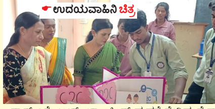
ಸ್ಪಾಕ್ ಎಕ್ಸ್‌ಪೋ, ಬ್ಯಾಂಕಿಂಗ್ ವ್ಯವಸ್ಥೆ ಸೇರಿದಂತೆ ವಾಣಿಜ್ಯ ಕ್ಷೇತ್ರದ ಪ್ರಮುಖ ವಿಷಯಗಳ ಕುರಿತು ಅರ್ಜಿಗಳ ಮೂಲಕ ಮಾದರಿ ರಂಗೋಲಿಯಲ್ಲಿ ಬಿಡುಗಡೆ ನೀಡಿ ಸ್ಪರ್ಧಿಸಲಾಯಿತು. ಇನ್ನು 'ಜಿರೋ ಫ್ಲೇವ್ ಚಿಟ್' ಬೆಂಕಿ ರಿಟೆ ಅಡುಗೆ ಸ್ಪರ್ಧೆಯಲ್ಲಿ ವಿದ್ಯಾರ್ಥಿಗಳು ಪಾಲ್ಗೊಂಡು, ಒಲೆ ಬಳಸದೆ ವೈವಿಧ್ಯಮಯ ಹಾಗೂ ರುಚಿಕರವಾದ ತಿಂಡಿ-ತಿನಿಸುಗಳನ್ನು ತಯಾರಿಸಿ ನೆರೆದಿದ್ದವರನ್ನು ರಂಜಿಸಿದರು. ಬಿಎಂಎಸ್ ಮೈಂಡ್ ಸ್ಪಾಕ್ (ರಸಪ್ರಶ್ನೆ): ತೃತೀಯ

ಅಧ್ಯಕ್ಷಿಣಿ ಕಾಮರ್ಸ್ ಎಕ್ಸ್‌ಪೋ ವಾಣಿಜ್ಯ ಮತ್ತು ಪ್ರದರ್ಶನದಲ್ಲಿ ಪ್ರಥಮ ಬಿ.ಕಾಂ ವಿದ್ಯಾರ್ಥಿಗಳು ವಿವಿಧ ಬಿಸಿನೆಸ್ ಐಡಿಯಾಗಳು,