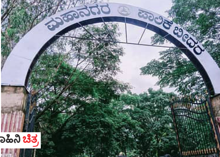
ಅಧಿಕಾರಿಗಳ ಮಾತು, ನಿರೀಕ್ಷೆಗಳಿಗೆ ನಿರೀಕ್ಷೆ ಮಾಡಿದರು. ಇದು ಜಿಲ್ಲಾ ಅಧಿಕಾರಿಗಳ ಕಾರ್ಯವೈಖರಿಗೆ ಒಡಿದೆ ಕನ್ನಡಿ.

ಉದಯವಾಹಿನಿ: ವಿದ್ಯುತ್ ಸಮಸ್ಯೆಯಿಂದ ಬೀದರ್ ಮೆನ್‌ವೇರ್ ಉದ್ಯಮಿಗಳಿಗೆ ಪೆಟ್ಟು ಬಿದ್ದಿದ್ದು ಸಮರ್ಪಕ ವಿದ್ಯುತ್ ಇಲ್ಲದ ಮಧುವಿನ ಸೇರಿದಂತೆ ಇನ್ನಿತರ ಸಮಾರಂಭದ ಬಟ್ಟೆಗಳು