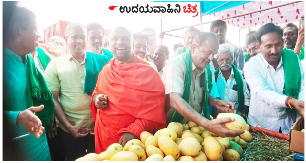
ಶ್ರೀಮಂಗಳನಾಥ ಸ್ವಾಮೀಜಿ ಭಾಗವಹಿಸಿ ಮಾತನಾಡಿದರು. ಈ 13 ಹಳ್ಳಿಗಳ 2823 ಎಕರೆ ಫಲವತ್ತಾದ ಕೃಷಿಭೂಮಿಗೆ ಸಂಬಂಧಿಸಿದಂತೆ ಸರಿಸುಮಾರು 1200 ರಿಂದ 1300 ಕುಟುಂಬಗಳು ಜೀವನ ನಡೆಸುತ್ತಿದ್ದಾರೆ ಹಾಗೂ ಇಲ್ಲಿನ ಭೂಮಿಯು ಸರ್ಕಾರದ ಅಂಕಿ

ಜಿಲ್ಲಾಡಳಿತ ಭವನದ ಎದುರು ಜಂಗಮಕೋಟೆ ಹೋಬಳಿಯ 13 ಹಳ್ಳಿಗಳ ಕೆಬಿಎಡಿಬಿ ಭೂ ಸ್ವಾಧೀನಕ್ಕೆ ವರೋಧಿಸಿ ರಾಜ್ಯ ರೈತ ಸಂಘ ಹಾಗೂ ಹೆಸರು ಸೇನೆ, ಕನ್ನಡಪರ, ದಲಿತಪರ ಹೋರಾಟಗಾರರು ನಡೆಸುತ್ತಿರುವ ಅನಿರೀಕ್ಷಾವಧಿ ಹೋರಾಟ ಬೆಂಬಲಿಸಿ 66ನೇ ದಿನವಾದ ಆದಿಚುಂಚನಗಿರಿ ಮಹಾಸಂಸ್ಥಾನ ಮಠದ ಸೀರಾಧ್ಯಕ್ಷರಾದ ಶ್ರೀ ಡಾ.ನಿರ್ಮಲಾನಂದ ನಾಥ ಮಹಾಸ್ವಾಮೀಜಿ ಪರವಾಗಿ ಅವರ ಪ್ರತಿನಿಧಿಯಾಗಿ ಚಿಕ್ಕಬಳ್ಳಾಪುರ ತಾಪಾ ಮಠದ