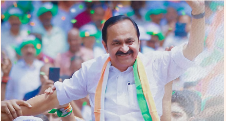
ಐಯುಎಲ್ ಸದಾ ಯುಡಿಎಫ್‌ನ ಜಾತ್ಯತೀತ ನಿಲುವನ್ನು ಬೆಂಬಲಿಸುತ್ತಾ ಬಂದಿದೆ. ಆ ಪಕ್ಷದ ಯಾವುದೇ ನಾಯಕರು ಕೋಮು ಸೌಹಾರ್ದತೆಗೆ ಧಕ್ಕೆ ತರುವಂತಹ ಹೇಳಿಕೆಗಳನ್ನು ನೀಡಿಲ್ಲ ಎಂದು ಅವರು ಹೇಳಿದ್ದಾರೆ. ತನ್ನ ಪ್ರಭಾವ ಹೆಚ್ಚಿರುವ ಕ್ಷೇತ್ರಗಳಲ್ಲಿ ಹಲವು ಕಾಂಗ್ರೆಸ್ ಅಭ್ಯರ್ಥಿಗಳ ಗೆಲುವನ್ನು ವಿಚಿತ್ರ ಪಡಿಸಿಕೊಳ್ಳುವಲ್ಲಿ ಐಯುಎಲ್ ಪ್ರಮುಖ ಪಾತ್ರ ವಹಿಸಿದೆ. ಜತೆಗೆ, ಇತರ ಮಿತ್ರ ಪಕ್ಷಗಳು ಸಹ ಯುಡಿಎಫ್‌ನಿಂದ ಪರಸ್ಪರ ಬೆಂಬಲಿಸಿಕೊಂಡಿವೆ ಎಂದಿದ್ದಾರೆ. ಸರ್ಕಾರದಲ್ಲೂ ಐಯುಎಲ್ ಜತೆ ಇಂತಹದೇ ಸಮಯದ ಮುಂದುವರಿಯಲಿತ್ತು, ರಾಜ್ಯದ ಅಭಿವೃದ್ಧಿಗಾಗಿ ಒಟ್ಟಾಗಿ ಶ್ರಮಿಸುತ್ತೇವೆ ಎಂದು ಅವರು ವಿಶ್ವಾಸ ವ್ಯಕ್ತಪಡಿಸಿದ್ದಾರೆ. ಖಾತೆ ಹಂಚಿಕೆ ಕುರಿತು ಮಾತನಾಡಿದ ಸತೀಶನ್, ಪ್ರಾಥಮಿಕ ಹಂತದ ಚರ್ಚೆಗಳು ಪೂರ್ಣಗೊಂಡಿವೆ. ವಿಧಾನಸಭಾ ಚುನಾವಣೆಯ ಸೀಟು ಹಂಚಿಕೆ ವೇಳೆ ಇದ್ದಂತಹ ಸೌಹಾರ್ದಯುತ ಮನೋಭಾವ ಖಾತೆ ಹಂಚಿಕೆಯಲ್ಲೂ ಇರಲಿದೆ ಎಂದಿದ್ದಾರೆ.

ಐಯುಎಲ್ ರಾಜ್ಯ ಅಧ್ಯಕ್ಷ ಸಯ್ಯದ್ ಸಾದಿಕ್ ಅಲಿ ಹಿಪಾತ್ ತಂಗಳ್ ಅವರ ಬೆಂಬಲದೊಂದಿಗೆ ನಾವು ಸದನದ ಒಳಗೆ ಮತ್ತು ಹೊರಗೆ ಒಗ್ಗಟ್ಟಾಗಿ ಹೋರಾಟ ನಡೆಸಿದ್ದೇವೆ' ಎಂದಿದ್ದಾರೆ. ಯುಡಿಎಫ್ ಮೈತ್ರಿಕೂಟ ಪ್ರಬಲ ಜಾತ್ಯತೀತ ನಿಲುವನ್ನು ತಳೆದಿದ್ದು, ಅದನ್ನು ರಾಜ್ಯದ ಜನರು ಅನುಮೋದಿಸಿದ್ದಾರೆ. ಆ ನಿಲುವಿನ ಹಿಂದೆ ತಂಗಳ್ ಅವರ ಶಕ್ತಿಯಿತ್ತು. ಕೊನೆಯ ಪ್ರಚೋದನೆ ಮೂಲಕ ಜನರನ್ನು ವಿಭಜಿಸಲು ಹಲವು ಶಕ್ತಿಗಳು ಯತ್ನಿಸಿದವು. ಆದರೆ, ಐಯುಎಲ್ ಮತ್ತು ತಂಗಳ್ ತಳೆದ ನಿಲುವು ನನಗೆ ಆಶ್ಚರ್ಯ ಮೂಡಿಸಿತು' ಎಂದು ಸತೀಶನ್ ವಿವರಿಸಿದ್ದಾರೆ. ಬಾಬರಿ ಮಸೀದಿ ದ್ವಂದ್ವದ ಅವಧಿಯಲ್ಲೂ ಐಯುಎಲ್ ನಾಯಕತ್ವವು ಇಂತಹುದೇ ಜಾತ್ಯತೀತ ನಿಲುವನ್ನು ತಳೆದಿತ್ತು.