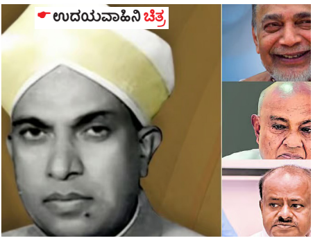
ರಾಜ್ಯದ ಆಡಳಿತ ಸೌಧವಾದ ವಿಧಾನಸೌಧ ನಿರ್ಮಿಸಿದ ಖ್ಯಾತಿಯ ಇವರು ರಾಮನಗರ ತಾಲ್ಲೂಕಿನವರು. ಅಂದಿನ ಮೈಸೂರು

ರಾಜ್ಯದಲ್ಲಿ ನಾಯಕತ್ವ ಬದಲಾವಣೆಗೆ ಕಡೆಗೂ ಕಾಲ ಕೂಡಿ ಬಂದಿದೆ. ಜಿಲ್ಲೆಯವರೇ ಆಗಿರುವ ಕನಕಪುರ ಪ್ರತಿನಿಧಿಸುವ ಉಪ ಮುಖ್ಯಮಂತ್ರಿ ಡಿ.ಕೆ. ಶಿವಕುಮಾರ್ ಅವರ ಮುಖ್ಯಮಂತ್ರಿ ಹುದ್ದೆಯ ಹಾದಿ ಬಹುತೇಕ ಅನಿವಾರ್ಯವಾಗಿದೆ. ಅಂದುಕೊಂಡಂತೆ ಎಲ್ಲವೂ ಸುಗಮವಾಗಿ ನಡೆದು ಶಿವಕುಮಾರ್ ಅಧಿಕಾರ ಸ್ವೀಕರಿಸಿದರೆ ಜಿಲ್ಲೆಯಿಂದ ಮುಖ್ಯಮಂತ್ರಿ ಹುದ್ದೆಗೇರಿದ ಐದನೇ ರಾಜಕಾರಣಿಯಾಗಲಿದ್ದಾರೆ. ಅದರಲ್ಲೂ ಕಾಂಗ್ರೆಸ್‌ನಿಂದ ಮುಖ್ಯಮಂತ್ರಿ ಸ್ಥಾನಕ್ಕೇರಿದ ಜಿಲ್ಲೆಯ ಎರಡನೇ ರಾಜಕಾರಣಿ ಎಂಬ ಹೆಗ್ಗಳಿಕೆ ಅವರದ್ದಾಗಲಿದೆ. ಕೆಂಗಲ್ ಹನುಮಂತಯ್ಯ ಕೆಂಗಲ್ ಹನುಮಂತಯ್ಯ ಕರ್ನಾಟಕದ ಮೊದಲ ಚುನಾಯಿತ ಮುಖ್ಯಮಂತ್ರಿ ಎಂಬ ಖ್ಯಾತಿ ಕೆಂಗಲ್ ಹನುಮಂತಯ್ಯ ಅವರದ್ದು.