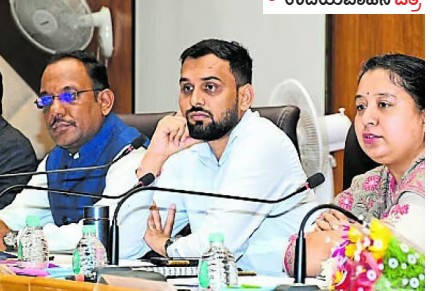
ಜಿಲ್ಲಾಧಿಕಾರಿ ಸೂಚನೆ ಸಭೆಯಲ್ಲಿ ಭಾಗವಹಿಸುತ್ತಿರುವ ಅಧಿಕಾರಿಗಳು.

ಉದಯವಾಹಿನಿ ಧಾರವಾಡ: ಪ್ರಧಾನಮಂತ್ರಿ ಉದ್ಯೋಗ ಸೃಷ್ಟಿ ಕಾರ್ಯಕ್ರಮ (ಪಿಎಂಇಜಿಪಿ) ಯೋಜನೆಯಡಿ 142 ಅರ್ಜಿಗಳಿಗೆ ಬ್ಯಾಂಕುಗಳಿಗೆ ಅರ್ಜಿಗಳನ್ನು ಸಲ್ಲಿಸಿ ಸಾಲಕ್ಕೆ ಹೊಂದಾಣಿಕೆ ಮಾಡಬಾರದು ಅಧಿಕಾರಿಗಳಿಗೆ ಜಿಲ್ಲಾಧಿಕಾರಿ ಸೂಚನೆ ನೀಡಿದ್ದಾರೆ.