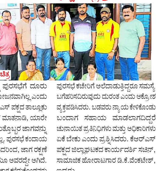
ಒಂದು ವರ್ಷದಿಂದ ಜಾಗ ಕಳೆದುಕೊಂಡವರು ಪುರಸಭೆ ಕೆಳಗೆ ಅಲೆದಾಡುತ್ತಿದ್ದರೂ ಸಮಸ್ಯೆ ಬಗೆಹರಿಸದಿದ್ದರಿಂದ ದುರಂತ ಎಂದು ಆರೋಪಿಸಿದರು.