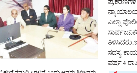
ಸಾರ್ವಜನಿಕ ಸಮ್ಮೇಳನದ ಅಂಗವಾಗಿ ಅವರು ತಿಳಿಸಿದರು. ಟ್ರಾಫಿಕ್ ದಂಡ ರಿಯಾಯಿತಿ ಸಂಚಾರ ನಿಯಮಗಳ ಉಲ್ಲಂಘನೆ ಪ್ರಕರಣಗಳಿಗೆ ಶೇಕಡಾ 50 ರಿಯಾಯಿತಿ ನೀಡಿರುವುದರಿಂದ ಸಾರ್ವಜನಿಕರು ಇದರ ಗರಿಷ್ಠ ಪ್ರಯೋಜನ ಪಡೆದುಕೊಳ್ಳುವಂತಾಗಲು ಪೊಲೀಸ್ ಇಲಾಖೆ ಅರಿವು ಮೂಡಿಸಬೇಕು ಎಂದು ನ್ಯಾಯಾಧೀಶರು ತಿಳಿಸಿದರು. ವಾಹನದ ವಿರುದ್ಧ 1991 ರಿಂದ 2022 ಇಸವಿಯವರೆಗೆ ದಾಖಲಾಗಿರುವ ಪ್ರಕರಣಗಳಿಗೆ ಶೇಕಡಾ 50 ರಿಯಾಯಿತಿ ಅನ್ವಯವಾಗಲಿದೆ. ಇದರಿಂದ ದಂಡ ವಸೂಲಾತಿ ಹಾಗೂ

ಉದಯವಾಹಿನಿ, ಮಂಗಳೂರು ನ್ಯಾಯಾಲಯಗಳಲ್ಲಿ ಚಿಕಿತ್ಸಾ ವೆಚ್ಚಗಳ ಬಹಳಷ್ಟು ಹೆಚ್ಚುತ್ತಿರುವುದರಿಂದ 2026 ರ ಜುಲೈ 18 ಮತ್ತು ನವೆಂಬರ್ 21 ರಂದು ವಿಶೇಷ ಲೋಕ ಅದಾಲತ್ ನಡೆಯಲಿದೆ ಎಂದು ಖಾಯಂ ಜನತಾ ನ್ಯಾಯಾಲಯದ ನ್ಯಾಯಾಧೀಶ ಕೃಷ್ಣಶಂಕರ್ ಹೇಳಿದ್ದಾರೆ. ಅವರು ಜಿಲ್ಲಾ ನ್ಯಾಯಾಲಯ ಸಭಾಂಗಣದಲ್ಲಿ ರಾಷ್ಟ್ರೀಯ ಲೋಕ ಅದಾಲತ್ ಕುರಿತು ಪೊಲೀಸ್ ಹಾಗೂ ಇತರ ಅಧಿಕಾರಿಗಳೊಂದಿಗೆ ಸಭೆ ನಡೆಸಿ ಮಾತನಾಡಿದರು. ಚಿಕಿತ್ಸಾ ವೆಚ್ಚಗಳಲ್ಲಿ ಸಮಸ್ಯೆ, ವಾರಂಟ್ ಜಾರಿಯಾಗುತ್ತಿರುವುದರಿಂದ ಪೊಲೀಸರ ಮೇಲೂ ಒತ್ತಡ ಬೀಳುತ್ತಿದೆ. ಇಂತಹ ಪ್ರಕರಣಗಳಲ್ಲಿ ದೂರುದಾರ ಮತ್ತು ಆರೋಪಿ ರಾಜೀನಾಮೆ ಪ್ರಕರಣ ಮುಕ್ತಾಯಗೊಳಿಸಲು ಅವಕಾಶವಿದೆ. ಇದಕ್ಕಾಗಿ ಸಾರ್ವಜನಿಕ ಆಯಾ ತಾಲೂಕು ನ್ಯಾಯಾಲಯಗಳನ್ನು ಸಂಪರ್ಕಿಸಬಹುದಾಗಿದೆ. ಇದರಿಂದ ಪ್ರಕರಣಗಳು ತ್ವರಿತವಾಗಿ ಮುಕ್ತಾಯಗೊಂಡು