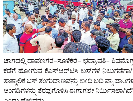
ಜಾಗದಲ್ಲಿ ದಾಖಲೆಗರೆ-ಸೂಳೆಕೆರೆ- ಭದ್ರಾವತಿ- ಶಿವಮೊಗ್ಗ ಕಡೆಗೆ ಹೋಗುವ ಕೆಎಸ್ಆರ್‌ಟಿಸಿ ಬಸ್‌ಗಳ ನಿಲುಗಡೆಗಾಗಿ ತಾತ್ಕಾಲಿಕ ಬಸ್ ತಂಗುದಾಣವನ್ನು ಬೀದಿ ಬದಿ ವ್ಯಾಪಾರಿಗಳ ಅಂಗಡಗಳನ್ನು ತೆರವುಗೊಳಿಸಿ ಈಗಾಗಲೇ ನಿರ್ಮಿಸಲಾಗಿದೆ ಎಂದು ಹೇಳಿದರು. 'ಚಿತ್ರದುರ್ಗ- ಬೀದರ- ಕಡೂರು- ಚಿಕ್ಕಮಗಳೂರು- ಸಂತೆಬೆನ್ನೂರು ಕಡೆಗೆ ಹೋಗುವ ಬಸ್‌ಗಳ ನಿಲುಗಡೆಗಾಗಿ ತಾತ್ಕಾಲಿಕ ತಂಗುದಾಣ ನಿರ್ಮಿಸಲು ಕೆಎಸ್ಆರ್‌ಟಿಸಿ ಮುಂದಾಗಿದ್ದು, ತಂಗುದಾಣ ನಿರ್ಮಿಸುವ ಜಾಗ ಖಾಸಗಿ ಒಡೆತನಕ್ಕೆ ಸೇರಿದೆ. 'ಸಾರ್ವಜನಿಕ ಅನುಕೂಲಕ್ಕಾಗಿ ತಾತ್ಕಾಲಿಕ ತಂಗುದಾಣ ನಿರ್ಮಿಸಲು ನಮ್ಮದೇನು ಅಡ್ಡಿ ಇರುವುದಿಲ್ಲ. ಆದರೆ, ತಾತ್ಕಾಲಿಕ ತಂಗುದಾಣವನ್ನು ಇಷ್ಟು ದಿನಗಳಲ್ಲಿ ತೆರವುಗೊಳಿಸುವುದಾಗಿ ಲಿಖಿತ ರೂಪದಲ್ಲಿ ಬರೆಯಬೇಕೆಂದು ಮಾತ್ರ ನಿರ್ಮಾಣಕ್ಕೆ ಅನುಮತಿಯನ್ನು ನೀಡುತ್ತೇವೆ. ಇಲ್ಲದಿದ್ದರೆ ಯಾವುದೇ ಕಾರಣಕ್ಕೂ ಬಿಡುವುದಿಲ್ಲ' ಎಂದು ತಿಳಿಸಿದರು.

ಉದಯವಾಹಿನಿ, ಚನ್ನಗಿರಿ: ಪಟ್ಟಣದ ಕೆರೆ ವಿರೋಧಿ ಜಾಗರಣೆ ತಾತ್ಕಾಲಿಕವಾಗಿ ಕೆಎಸ್ಆರ್‌ಟಿಸಿ ಬಸ್ ತಂಗುದಾಣ ನಿರ್ಮಾಣಕ್ಕೆ ಜಮೀನಿನ ಮಾಲೀಕ ಹಾಗೂ ಸಾರ್ವಜನಿಕರು ತೀವ್ರ ವಿರೋಧ ವ್ಯಕ್ತಪಡಿಸಿ ಪ್ರತಿಭಟನೆ ನಡೆಸಿದರು. ಈಗಾಗಲೇ ಪಟ್ಟಣದ ಹೊರ ವಲಯದ ಅಜ್ಜಿಹಳ್ಳಿ ಗ್ರಾಮದಲ್ಲಿ ಕೆಎಸ್ಆರ್‌ಟಿಸಿ ಬಸ್ ಡಿಪೋ ನಿರ್ಮಾಣಗೊಂಡು ಲೋಕಾರ್ಪಣೆಯಾಗಿ ಒಂದು ವರ್ಷವಾಗುತ್ತಾ ಬಂದಿದೆ. ಆದರೆ ಇದುವರೆಗೂ ಸ್ಥಳೀಯ ಅಡಳಿತ ಹಾಗೂ ಪುರಸಭೆಯವರು ಕೆಎಸ್ಆರ್‌ಟಿಸಿ ಬಸ್‌ಗಳ ನಿಲುಗಡೆಗಾಗಿ ಪ್ರತ್ಯೇಕ ಬಸ್ ನಿಲ್ದಾಣಕ್ಕಾಗಿ ಅಗತ್ಯ ಜಾಗ ಕೊಡಲು ಸಾಧ್ಯವಾಗಿಲ್ಲ. ಹಾಗೆಯೇ ಪಟ್ಟಣದಲ್ಲಿ ಪುರಸಭೆಯಿಂದ ನಿರ್ಮಿಸಿರುವ ಬಸ್ ನಿಲ್ದಾಣ ಖಾಸಗಿ ಬಸ್‌ಗಳ ನಿಲುಗಡೆಗೆ ಸೀಮಿತವಾಗಿದೆ. ಏಕೆಂದರೆ ಖಾಸಗಿ ಬಸ್‌ನವರು ಪ್ರತಿ ದಿನ ಬಸ್ ನಿಲ್ದಾಣದ ಪ್ರವೇಶಕ್ಕಾಗಿ ಶುಲ್ಕವನ್ನು ನೀಡುತ್ತಿದ್ದಾರೆ. ಹಾಗಾಗಿ ಕೆಎಸ್ಆರ್‌ಟಿಸಿ ಬಸ್‌ಗಳು ಖಾಸಗಿ ಬಸ್ ನಿಲ್ದಾಣದೊಳಗೆ ಪ್ರವೇಶಿಸದಂತೆ ಖಾಸಗಿ ಬಸ್‌ಗಳ ಮಾಲೀಕರು ತಡೆಯೊಡ್ಡಿದ್ದಾರೆ ಎಂದು ಪ್ರತಿಭಟನೆಕಾರರು ದೂರಿಸಿದರು. ಕೆಎಸ್ಆರ್‌ಟಿಸಿ ಬಸ್‌ಗಳ ನಿಲುಗಡೆಗಾಗಿ ಪ್ರತ್ಯೇಕ ನಿಲ್ದಾಣ ಮಾಡುವವರೆಗೆ ಹೆದ್ದಾರಿ ಬದಿಯಲ್ಲಿ ತಾತ್ಕಾಲಿಕ ಬಸ್ ತಂಗುದಾಣ ನಿರ್ಮಿಸಿ ಕೊಡಬೇಕೆಂಬ ಉದ್ದೇಶದಿಂದ ಶಾಶ್ವತ ಬಸವರಾಜು ಶಿವಗಂಗಾ ತಾತ್ಕಾಲಿಕ ಬಸ್ ತಂಗುದಾಣ ನಿರ್ಮಿಸಲು ಸೂಚನೆ ನೀಡಿದ್ದರು. ಆದರೆ ತಕ್ಷಣ ಪಟ್ಟಣದ ಗಣಪತಿ ಹೊರಡದ ಬಳಿ ಇರುವ