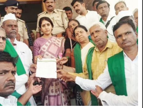
ಅನ್ವಯ ತಿರಸ್ಕರಿಸಿ, ರಾಜ್ಯದ ವಿದ್ಯುತ್ ವಿತರಣಾ ವ್ಯವಸ್ಥೆಯನ್ನು ಸರ್ಕಾರದ ಅಧೀನದಲ್ಲಿಯೇ ಮುಂದುವರಿಸುವಂತೆ ಸೂಕ್ತ ಕಾನೂನು ಕ್ರಮ ಕೈಗೊಳ್ಳಬೇಕು ಎಂದು ಮನವಿಯಲ್ಲಿ ಒತ್ತಾಯಿಸಲಾಗಿದೆ. ಬೇಡಿಕೆಗಳನ್ನು ಸರ್ಕಾರ ಪರಿಗಣಿಸದಿದ್ದರೆ ಜಿಲ್ಲೆಯಾದ್ಯಂತ ಬೀದರ ಉಗ್ರ ಹೋರಾಟ ನಡೆಸಲಾಗುವುದು. ಯಾವುದೇ ಅಂತಿಮತರ ಘಟನೆಗಳಿಗೆ ಸರ್ಕಾರವೇ ಹೊಣೆಯಾಗಲಿದೆ ಎಂದು ಸಂಘದ ಮುಖಂಡರು ಎಚ್ಚರಿಕೆ ನೀಡಿದ್ದಾರೆ.

ಉದಯವಾಹಿನಿ, ಬೀದರ: ಕರ್ನಾಟಕ ರಾಜ್ಯದಲ್ಲಿ ವಿದ್ಯುತ್ ವಿತರಣಾ ಕ್ಷೇತ್ರವನ್ನು ಖಾಸಗೀಕರಣಗೊಳಿಸದೆ, ಸರ್ಕಾರದ ಅಧೀನದಲ್ಲಿಯೇ ಯಥಾಸ್ಥಿತಿಯಲ್ಲಿ ಮುಂದುವರಿಸಬೇಕು ಎಂದು ಕರ್ನಾಟಕ ರಾಜ್ಯ ರೈತ ಸಂಘ ಹಾಗೂ ಹಸಿರು ಸೇನೆ, ಬೀದರ ಜಿಲ್ಲಾ ಘಟಕದಿಂದ ಜಿಲ್ಲಾಧಿಕಾರಿಗಳ ಮುಖಾಂತರ ಮುಖ್ಯಮಂತ್ರಿ ಡಿ.ಕೆ. ಶಿವಕುಮಾರ್ ಅವರಿಗೆ ಮನವಿ ಸಲ್ಲಿಸಿದ್ದಾರೆ. ರಾಜ್ಯದ ಎಲ್ಲಾ ವಿದ್ಯುತ್ ವಿತರಣಾ ಕಂಪನಿಗಳು ಈಗಾಗಲೇ ಉತ್ತಮವಾಗಿ ಕಾರ್ಯನಿರ್ವಹಿಸುತ್ತಿದ್ದು, ಸಾರ್ವಜನಿಕರು, ರೈತರು ಹಾಗೂ ಕೈಗಾರಿಕೋದ್ಯಮಿಗಳಿಗೆ ಸಮರ್ಪಕ ಸೇವೆ ಒದಗಿಸುತ್ತಿವೆ ಎಂದು ತಿಳಿಸಲಾಗಿದೆ ಸರ್ಕಾರದ ವಿವಿಧ ಯೋಜನೆಗಳನ್ನು ಅನುಷ್ಠಾನಗೊಳಿಸುವಲ್ಲಿ ವಿದ್ಯುತ್ ವಿತರಣಾ ಕಂಪನಿಗಳು ಪ್ರಮುಖ ಪಾತ್ರ ವಹಿಸುತ್ತಿವೆ. ಇಂತಹ ಸಂದರ್ಭದಲ್ಲಿ ಖಾಸಗೀಕರಣದಿಂದ ವಿದ್ಯುತ್ ವಿತರಣಾ ಕ್ಷೇತ್ರದಲ್ಲಿ ಅವಕಾಶ ನೀಡಿದರೆ ಸರ್ಕಾರದ ಸೇರಿಸಿ ಯೋಜನೆಗಳ ಕಡಿಮೆಯಾಗಲಿದ್ದು, ಸಾರ್ವಜನಿಕರು, ರೈತರು ಹಾಗೂ ಕೈಗಾರಿಕೆಗಳಿಗೆ ಅನ್ಯಾಯವಾಗುವ ಸಾಧ್ಯತೆ ಇದೆ ಎಂದು ಸಂಘ ಅಳಿ ವ್ಯಕ್ತಪಡಿಸಿದ್ದಾರೆ. ಟಾಟಾ ವರ್ವೆ ಕಂಪನಿಯವರು ಸಲ್ಲಿಸಿರುವ ಅರ್ಜಿಯನ್ನು ವಿದ್ಯುತ್ ಕಾಯಿದೆ-2003 ರ ಸೆಕ್ಷನ್ 108 ರ