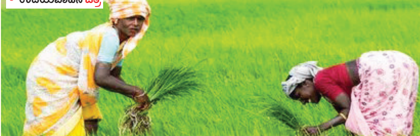
ರೈತರು/ಕೃಷಿ ಕಾರ್ಮಿಕರು ತೋಟಗಳಲ್ಲಿ ಕೆಲಸ ಮಾಡುವ ಸಂದರ್ಭದಲ್ಲಿ ಸೊಳ್ಳೆಗಳು ಕಟ್ಟಿದಂತೆ ಅಗತ್ಯ ಮನ್ನಣೆ ಕ್ರಮಗಳನ್ನು ಕೈಗೊಳ್ಳಬೇಕು. ಸಿಡಿಬೆ/ಗಾಳಿಯಿಂದ ಹಾನಿಯಾಗದಂತೆ ಈಗಾಗಲೇ ಜಿಲ್ಲಾಡಳಿತದ ಹೊರಡಿಸಿದ ಮಾರ್ಗಸೂಚಿಯನ್ವಯ ಮುನ್ನೆಚ್ಚರಿಕೆ ಕ್ರಮ ಕೈಗೊಳ್ಳುವಂತೆ ಪ್ರಕಟಣೆ ತಿಳಿಸಿತು. ತೋಟಗಾರಿಕೆ ಇಲಾಖೆಯ ಜಂಟಿ ನಿರ್ದೇಶಕರ ಕಛೇರಿ

ಜಿಲ್ಲೆಯ ವಾರ್ಷಿಕ 4500 ಮಿ.ಮೀ. ಗಿಂತಲೂ ಹೆಚ್ಚು ಮಳೆಯಾಗುವ ಪ್ರದೇಶವಾಗಿದ್ದು, ಜಿಲ್ಲೆಯ ಪ್ರಮುಖ ತೋಟಗಾರಿಕೆ ಬೆಳೆಗಳಾದ ಅಡಿಕೆ, ತೆಂಗು ಹಾಗೂ ಕಾಳುಮೆಣಸು ಬೆಳೆಗಳು ವಿಪರೀತ ಮಳೆಯಿಂದಾಗಿ ವಿವಿಧ ರೀತಿಗಾಗಿ ತುತ್ತಾಗುವ ಸಾಧ್ಯತೆ ಇದ್ದು, ಅಸಮರ್ಪಕ ನಿರ್ವಹಣೆಯಿಂದಾಗಿ ಇಳುವರಿ ನಷ್ಟವಾಗುವುದಲ್ಲದೆ, ರೋಗಬಾಧೆ ಉಲ್ಬಣವಾಗಿ ಮರಗಳು ಸಂಪೂರ್ಣವಾಗಿ ನಾಶವಾಗುವ ಸಾಧ್ಯತೆ ಇರುತ್ತದೆ. ಮಳೆಗಾಲದಲ್ಲಿ ಮೋಡ ಕವಿದ ವಾತಾವರಣ, ತೋಟದಲ್ಲಿ ನೀರು ನಿಲ್ಲುವಿಕೆ, ಹೆಚ್ಚಿನ ಮಣ್ಣಿನ ತೇವಾಂಶ, ಪೋಷಕಾಂಶಗಳ ಕೊರತೆ ಮತ್ತು ಸೂರ್ಯನ ಬೆಳಕಿನ ಕೊರತೆ ಮುಂತಾದ ಹಲವು ಕಾರಣಗಳಿಂದಾಗಿ ಅಡಿಕೆ ಕೊಳೆ ರೋಗ, ಕಾಳುಮೆಣಸು ಸೊರಗು ರೋಗ ಹಾಗೂ ತೆಂಗಿನಲ್ಲಿ ಸುಳಿಕೊಳೆ ರೋಗ ಉಲ್ಬಣಿಸುವ ಸಾಧ್ಯತೆ ಇರುತ್ತದೆ. ಅಡಿಕೆ ಮತ್ತು ತೆಂಗಿನಲ್ಲಿ ಮಳೆಗಾಲದಲ್ಲಿ ಕೊಳೆ ರೋಗ ನಿರಂತ್ರಣ ಕ್ರಮಗಳನ್ನು ಕೈಗೊಳ್ಳದ ಇದ್ದಲ್ಲಿ, ಅಕ್ಟೋಬರ್ ತಿಂಗಳಿನಿಂದ ಫೆಬ್ರವರಿವರೆವಿಗೂ ಹೆಚ್ಚಾಗುವ ಮಂಜಿನ ಹನಿಗಳು ರೋಗಾಣುಗಳು ಅಭಿವೃದ್ಧಿಗೊಂಡು ಹೊರಬರಲಾಗಿದ್ದು, ಕೊಳೆ ರೋಗ ಕಾರಣವಾದ ಶಿಲೀಂಜನ ರೋಗಾಣುಗಳು ಅಭಿವೃದ್ಧಿ ಹೊಂದಿ ಶಿಲೀಂಜನ ಮತ್ತು ಕೊಳೆ ರೋಗಗಳಿಂದಾಗಿ ಅಡಿಕೆ/ ತೆಂಗಿನ ಮರಗಳು ಸಾಯುವ ಸಂಭವ ಹೆಚ್ಚಾಗುತ್ತದೆ.