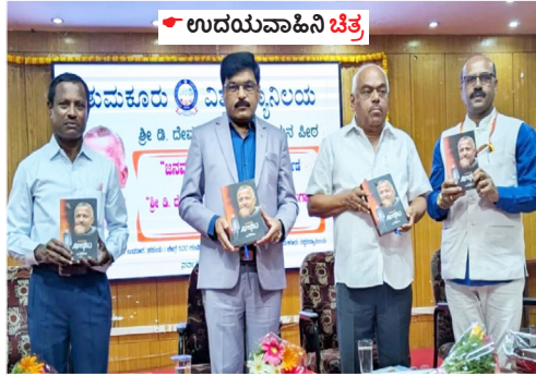
ಉದಯವಾಹಿನಿ ಚಿತ್ರ ಸಮಮಾಜದ ಕನಸುಗಾರ ರಾಜ್ಯ ಮಟ್ಟದ ವಿಚಾರ ಸಂಕರಣ