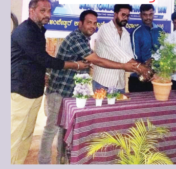
ಶಾಲಾ ಆವರಣದಲ್ಲಿ ವಿದ್ಯಾರ್ಥಿಗಳು ಗಿಡ ನೆಟ್ಟು ಬೆಳೆಸಬೇಕು. ನಾವು ವ್ಯಕ್ತವನ್ನು ಬೆಳೆಸಿದರೆ ಅದು ನಮ್ಮನ್ನು ರಕ್ಷಿಸಿ ಮಾಡುತ್ತದೆ.