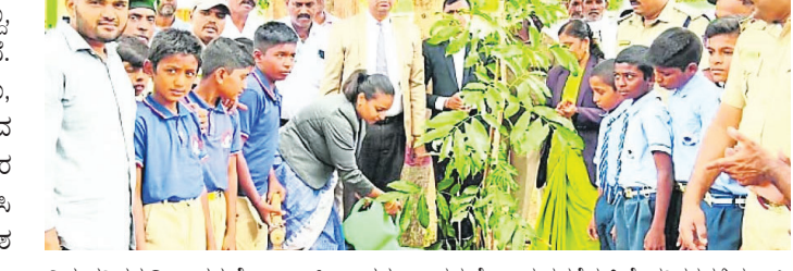
ವಿಶ್ವ ಪರಿಸರ ದಿನಾಚರಣೆ ಉದ್ಘಾಟನೆ ಅವರು ಮಾತನಾಡಿದರು. ಮಾನವ ತನ್ನ ಆಗತ್ಯಗಳಿಗಿಂತಲೂ ಹೆಚ್ಚಾಗಿ ನೈಸರ್ಗಿಕ ಸಂಪನ್ಮೂಲಗಳನ್ನು ದುರುಪಯೋಗಪಡಿಸಿಕೊಂಡು ಅವುಗಳ ನಾಶಕರ ಮುಂದಾಗಿದ್ದಾನೆ. ಆದ್ದರಿಂದ ಪರಿಸರ ಸಮತೋಲನ ಹದಗೆಟ್ಟಿದೆ. ಪರಿಸರದಲ್ಲಿನ ಗಾಳಿ, ನೀರು, ಬೆಳಕು ಮತ್ತು ಮಣ್ಣು ಅತ್ಯಮೂಲ್ಯವಾದ ಸಂಪನ್ಮೂಲಗಳಾಗಿವೆ. ಹೀಗಾಗಿ ಮುಂದಿನ ಪೀಳಿಗೆಗೆ ಅವುಗಳನ್ನು ಉಳಿಸಬೇಕಾದ ಅನಿವಾರ್ಯತೆ ಎದುರಾಗಿದೆ' ಎಂದು ತಿಳಿಸಿದರು.