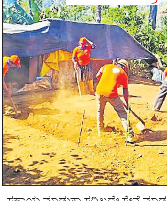
ಸಹಾಯ ಮಾಡುತ್ತಾ ಸದಿಲ್ಲದೇ ಸೇವೆ ಮಾಡುತ್ತಿದ್ದಾರೆ. ಪ್ರಸ್ತುತ

ಬಿರುಸಿನ ಮಳೆ ಸುರಿದಾಗ ನಡೆಸಬೇಕಾದ ರಸ್ತೆಯಲ್ಲಿನ ಹೊಂಡಗಳಲ್ಲಿ ನೀರು ತುಂಬಿಕೊಂಡು ಸಂಚಾರ ದುಸ್ಥರ, ಶಾಲೆಯ ಚಾವಣಿಯಲ್ಲಿ ಕೆಸು ಕಡ್ಡಿ ಸೇರಿಕೊಂಡು ಕೊರಡೆಗಳಲ್ಲಿ ನೀರು ಜನಿಸುತ್ತಿದೆ, ವೃದ್ಧರು ವಾಸಿಸುವ ಮನೆ ಸುಣ್ಣ ಬಣ್ಣವಿಲ್ಲದೇ ಕೆಳಗಿಂದಿದ್ದು ಬಣ್ಣ ಬಳಿಯುವವರು ಇಲ್ಲ ಎಂಬ ಚಿಂತೆ, ಕಾವೇರಿ ನದಿ ಒಡಲಲ್ಲಿ ತ್ಯಾಜ್ಯ ತುಂಬಿ ಕಲುಷಿತಗೊಂಡ ನೀರು, ಚರಂಡಿ ವ್ಯವಸ್ಥೆ ಇಲ್ಲದೇ ಹರಿಯುವ ಮಳೆ ನೀರು, ಅನಾರೋಗ್ಯದಿಂದ ಬಳಲುವ ಕೋಟಿಗಟ್ಟುಗಳು... ಇಂತಹ ನಿತ್ಯದ ಸಮಸ್ಯೆಗಳ ಪರಿಹಾರಕ್ಕೆ ತಟ್ಟನೆ ನೆನಪಾಗುವುದು ಶೌರ್ಯ ವಿಪತ್ತು ನಿರ್ವಹಣಾ ತಂಡ. ಬಡವರ, ಅಸಹಾಯಕರ ಸಮಸ್ಯೆಗಳಿಗೆ ತಕ್ಷಣ ಸ್ಪಂದಿಸುವ ಶೌರ್ಯ ತಂಡ ಹಲವು ಜನಪರ ಕಾರ್ಯಕ್ರಮಗಳನ್ನು ಮಾಡಿ ಮನ್ನಣೆ ಗಳಿಸುತ್ತಿದೆ. ಇಲ್ಲಿನ ಶೌರ್ಯ ತಂಡದ ಸದಸ್ಯರು ಬಡವರ ಸಮಸ್ಯೆಗಳಿಗೆ ಸ್ಪಂದಿಸುತ್ತ ತಮ್ಮ ಕೈಲಾದ