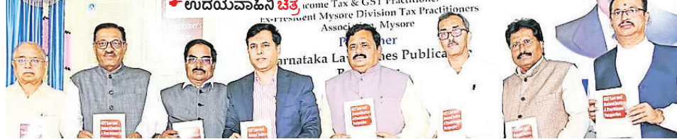
'ಜೀವಿಸ್‌ಟಿ ಅರ್ಥೈಸಿಕೊಳ್ಳುವುದು ಸರ್ಕಾರವು, ಉಳಿದ ಸಾಹಿತ್ಯಕ್ಕೆ ಹೋಲಿಸಿದರೆ ಈ ಬಗ್ಗೆ ಬಂದಿರುವ ಪ್ರತಿಭಟನೆ ಕಡಿಮೆ. ಸರ್ಕಾರ, ಸ್ಪಷ್ಟ, ನಿಖರ ಮಾಹಿತಿ ಒಳಗೊಂಡಿರುವ ಪ್ರಸ್ತುತಗಳು ಬಂದರೆ ತೆರಿಗೆದಾರರಿಗೆ ಅನುಕೂಲವಾಗುತ್ತದೆ.'