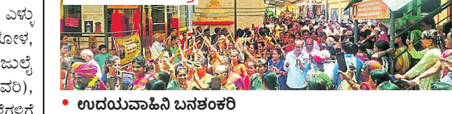
ಬನಶಂಕರಿ

ಬನಶಂಕರಿ ದೇವಿಯ ನೂತನ ರಥವನ್ನು ಭಕ್ತರು ಸಂಭ್ರಮದಿಂದ ಸಾಗಿಸಿದರು. ಬನಶಂಕರಿ ದೇವಿಗೆ ಭಕ್ತರ ಕಾಣಿಕೆಯಿಂದ 3 ಕೋಟಿ ವೆಚ್ಚದಲ್ಲಿ ನಿರ್ಮಿಸಿದ ನೂತನ ರಥಕ್ಕೆ ದೇವಾಲಯದ ಸುತ್ತ ಪ್ರದಕ್ಷಿಣೆ ಹಾಕುತ್ತ ಅದರಲ್ಲಿ ಬನಶಂಕರಿ ದೇವಿ ಶಾಕಾಂಶಿ ಶಂಭೂಕೋ... ಎಂದು ಭಕ್ತರು ಶ್ರದ್ಧೆ ಭಕ್ತಿಯನ್ನು ಮೆರೆದರು. ಗರ್ಭಗುಡಿಯಿಂದ ಬನಶಂಕರಿದೇವಿ ಉತ್ತಮ ಮೂರ್ತಿಯನ್ನು ಪಲ್ಲಕ್ಕಿಯಲ್ಲಿ ವಾದ್ಯ ವೈಭವದೊಂದಿಗೆ ಮರವಣಿಗೆ ಯಲ್ಲಿ ತಂದು ಆಚೆಕುರು ರಥದಲ್ಲಿ ಪ್ರತಿಷ್ಠಾನ ಮಾಡಿದರು. ಬೆಳ್ಳಿಯ ರಥಕ್ಕೆ ವಿವಿಧ ಪುಷ್ಪಮಾಲೆ, ಬಾಳೆಗಡೆ, ತಳಿರು ತೋರಣವನ್ನು ಕಟ್ಟಿ ಕಲಶಕ್ಕೆ ಹೊರಾಳಿ, ತಾವರೆ, ಗುಲಾಬಿ ಹೂವಿನ ಅಲಂಕಾರ ಮಾಡಲಾಗಿತ್ತು. ರಥದಲ್ಲಿ ಬೆಳ್ಳಿಯ ಬನಶಂಕರಿ ದೇವಿ ಉತ್ತಮ ಮೂರ್ತಿಯನ್ನು ಹೂವಿನ ಅಲಂಕಾರ ಮಾಡಲಾಗಿತ್ತು. ರಥದಲ್ಲಿ ಬೆಳ್ಳಿಯ ಬನಶಂಕರಿ ದೇವಿ ಉತ್ತಮ ಮೂರ್ತಿಯನ್ನು ಪ್ರತಿಷ್ಠಾನಿಸಲಾಗಿತ್ತು. ದೇವಾಲಯಕ್ಕೆ ಮರವಣಿಗೆ ಭಕ್ತರು ಬನಶಂಕರಿದೇವಿ ದರ್ಶನವನ್ನು ಪಡೆದರು. ನಾಡಿನ ವಿವಿಧ ಜಿಲ್ಲೆ, ಮಹಾರಾಷ್ಟ್ರ ಮತ್ತು ಗೋವಾದಿಂದ ಭಕ್ತರು ಆಗಮಿಸಿದ್ದರು. ರಥದ ಮುಂದೆ ಮಹಿಳೆಯರು ಕೋಲಾಟವನ್ನು ಪ್ರದರ್ಶಿಸಿದರು. ಭಕ್ತರು ಪ್ರಸಾದವನ್ನು ಸ್ವೀಕರಿಸಿದರು.